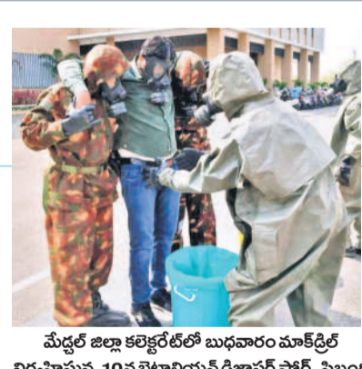
మేడల్ జిల్లా కలెక్టరేట్లో బుధవారం మాక్ డ్రీల్ నిర్వహిస్తున్న 10వ బెటాలియన్ డిజిజిఎస్ ఫోర్స్ సిబ్బంది

సాట్ల మయారాలు మాచిఫూర్ శిల్పారామంలో బుధవారం ఆకట్టుకున్న కళాకారుల నృత్యాలు