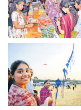
కైట్ ఫెస్టివల్ నంబురల్లో యువ సంపదడి