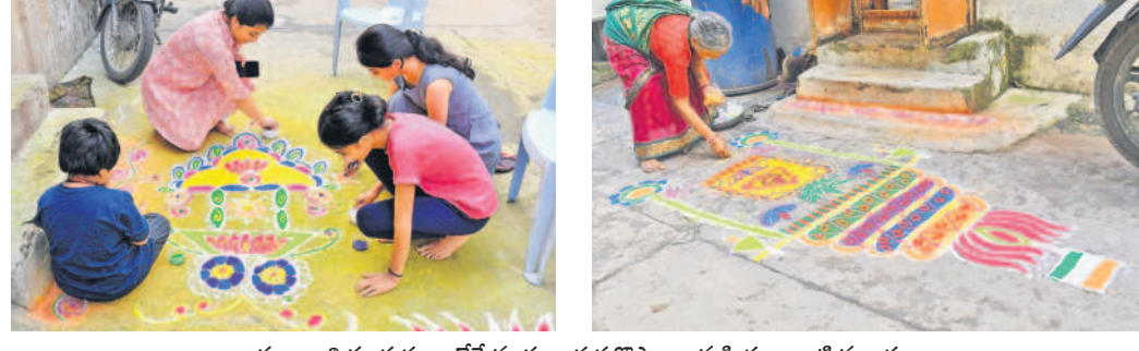
సంక్రాంతి పండుగ అంటేనే ముగ్గులు గుర్తుకొస్తాయి. మహిళలు ఇంటి ముందు రంగురంగులతో తీర్మా ముగ్గులు వేస్తున్నారు. సికింద్రాబాద్ నియోజకవర్గంలో ముగ్గులు వేసే రంగులతో అలంకరించారు.