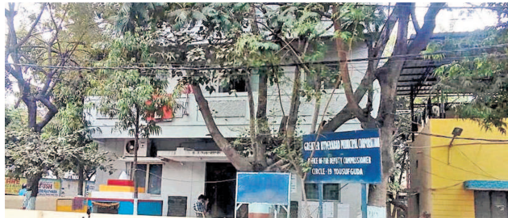
యూసుఫ్ గౌడ జిహాద్ సర్కిల్ కార్యాలయం