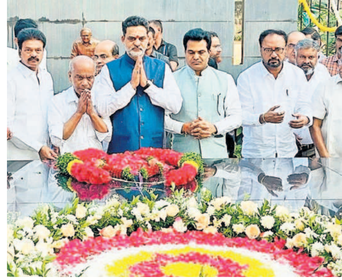
జైపాల్ రెడ్డికి ఘన నివాళి