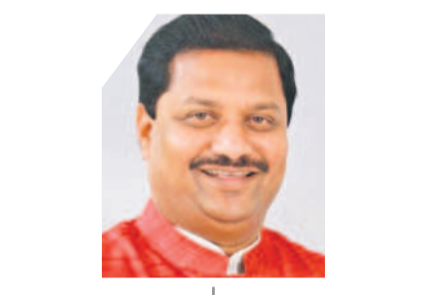
బూడిద బిక్కుమయ్య గౌడ్

తెలంగాణలో ఎక్కడ చూసినా ధర్మాలు, రాష్ట్ర రోడ్లు, నిరసనలే దర్శనమవుతున్నాయి. రైతులు, విద్యార్థులు, నిరుద్యోగులతో పాటు వివిధ వర్గాల ప్రజలు తమ తమ సమస్యల పరిష్కారం కోసం రోడ్లకొర్రుతున్నారు.