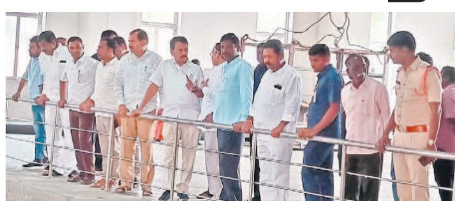
ఇంగ్లీషన్ అది కాలనీలో మాట్లాడుతున్న మంత్రి జూపల్లి కృష్ణారావు

అందుబాటులో తీసుకువస్తామని మంత్రి హామీ ఇచ్చారు. అదేవిధంగా నెలివిడి, నర్సంగాపురం, కొన్నూరు, ద్వారకానగర్ లోని చెరువులను నింపే వేసవిలో పశువులకు ఎలాంటి ఇబ్బందులు కలుగకుండా చూడాలని మంత్రి జూపల్లి అధికారులను ఆదేశించారు. మంత్రి వెంట ఇంగ్లీషన్ అధికారులు, కాంగ్రెస్ నాయకులు ఉన్నారు.