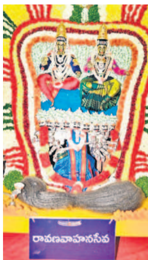
రావణ వాచనంపై ఆదివారం

శ్రీశైలం, జనవరి 14 : శ్రీశైల మహాక్షేత్రంలో మకర సంక్రాంతి బ్రహ్మోత్సవాలు వైభవంగా జరుగుతున్నాయి. అమంగళాలను తొలగించి భోగి మంటలతో సంప్రదాయ మట్టంతో ఆదివారం తెల్లవారజాము నుంచి మూడో రోజు ఉత్సవాలను జరుపుకోబడుతున్న ఈరోజు పెద్దదిగా జరిగింది. ఉత్సవాల్లో భాగంగా సాయంత్రం భ్రమరాంబామల్లికార్జున స్వామి అమ్మవార్లు రావణ వాచనంపై ఊరేగుతూ భక్తులకు దర్శనమిచ్చారు. అక్కడనుండి మండపంట్లో ఉత్సవమూర్తులను రావణ వాచనంపై వేంచేసి చేసి ప్రత్యేక పూజాధికారులు నిర్వహించారు. అనంతరం దమ్మ చమ్మక్క మేళాకాలంలో కళాకారుల సంప్రదాయ నిర్వహణను గ్రామీణులకు నిర్వహించారు. రావణవాచనంపై విహరించిన స్వామి అమ్మవార్లను వీక్షించేందుకు భక్తులు అధిక సంఖ్యలో పాల్గొన్నారు.