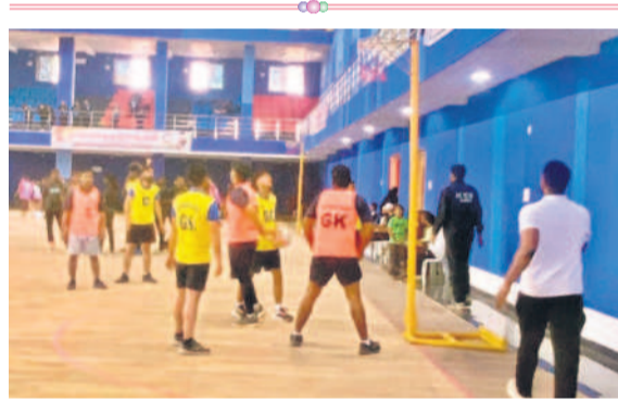
తలపడుతున్న ఆలంబ, ఉత్తరాఖండ్ పురుషుల జట్టు