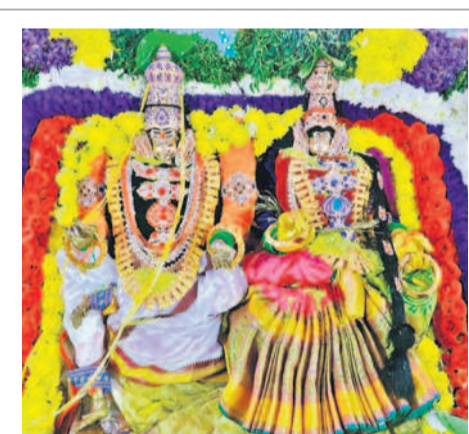
ఆలయంలో కొలువైన పార్వతీవరమహేశ్వరులు

చేసిన ప్రభలు ఉమామహేశ్వరానికి వస్తాయి. రాత్రి 2 గంటలకు స్వామి వారు ఉమామహేశ్వరం కొండపై నుంచి మంగళ వాయిద్యాలతో పల్లకి సేవతో కొండ కింది భోగమహేశ్వరం చేరుకుంటారు. 16న (మంగళవారం) తెల్లవారజామున నాలుగు గంటలకు పార్వతీ పరమేశ్వరుల కల్యాణోత్సవం వేదవంతులతో ప్రారంభం అవుతుంది. 17న (బుధవారం) రాత్రి 7 గంటలకు అష్టావహనం సేవ, 18న గురువారం రాత్రి 7 గంటలకు నందివాచనం సేవ కార్యక్రమం జరుగుతుంది.