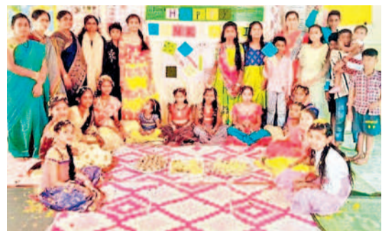
చిన్నారలకు భోగి పండ్ల వేడుక నిర్వహించిన రెయినబోల్ తెర్నింగ్ సెంటర్ సిబ్బంది

వేసి సంబురాలు జరుపుకున్నారు. మారడేపల్లిలో కొనుగోలుదారుల సందడి బేగంపేట్: సంక్రాంతి పండుగ నేపథ్యంలో లక్ష్మీవల్లోని ప్రధాన మార్కెట్లోని మోండా మార్కెట్లో పాటలు బస్టలు, కాలనీల్లో ప్రత్యేకంగా ఏర్పాటు చేసిన రంగుల విక్రయాల దుకాణాలు, చేరుకు విక్రయ కేంద్రాలు కొనుగోలుదారులతో సందడిగా మారాయి. గట్టిగ బిల్డింగ్లలో పతంగులు విరివిగా విక్రయమవుతున్నాయి. చిన్నా పెద్ద, తేడా లేకుండా అధిక సంఖ్యలో పతంగులు కొనుగోలు చేశారు.