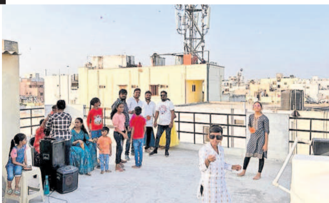
వారాసిగూడలో బిల్డింగ్లపై పతంగులు ఎగురవేస్తున్న యువకులు

సికింద్రాబాద్, జనవరి 14: సికింద్రాబాద్, కంటోన్మెంట్, సనత్ నగర్ నియోజకవర్గాల పరిధిలోని పలు ప్రాంతాల్లో ఆదివారం భోగి పండుగను ప్రజలు ఘనంగా జరుపుకున్నారు. మహిళలు తమ ఇండ్ల ఎదుట తెల్లవారు జామునే నిద్ర లేచి రంగు రంగుల ముగ్గులను అందంగా తీర్చిదిద్దారు. యువకులు పతంగులను ఎగురవేసారు. ఆటలు ఆడుతూ..పాటలు పాడుతూ సంబురాలు జరుపుకున్నారు. తీన్ మార్, డీజే పాటలకు కేరింతలు కొడుతూ