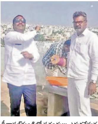
నీతాఫలంపేటలో పతంగులు ఎగురవేస్తున్న నాయకుడు మేకల సారంగపాణి

గాలి పటాల పోటీలో పాల్గొన్నారు. స్నేహితులు, బంధువులతో కలిసి భోగి పండుగను ఎంజాయ్ చేశారు. ఆలయాల్లో ప్రత్యేక పూజలు నిర్వహించారు. భక్తులకు ఎలాంటి అపొకర్యాలు కలుగకుండా ఆయా ఆలయాల నిర్వాహకులు ఏర్పాట్లు చేశారు. సికింద్రాబాద్ పరిధిలోని పలు ప్రాంతాల్లో భోగి మంటలు