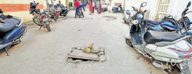
మేడిబావిలో ప్రమాదకరంగా మారిన మ్యూన్ హోళ్లు

సికింద్రాబాద్, జనవరి 14: నీతాఫలం మండలి డివిజన్ పరిధిలోని పలు ప్రాంతాల్లో మ్యూన్ హోళ్లు ప్రమాదకరంగా మారాయి. దీంతో పాదచారులు, వాహనదారులు ప్రమాదాల బారిన పడుతున్నారు. అధికారులకు దివ్యాంగులను చెప్పినా ఫలితం లేకుండా పోతున్నందున స్థానికులు వాపోతున్నారు. డివిజన్ పరిధిలోని మేడిబావి బస్ స్టేషన్ వద్ద మూతలు కుంగిపోయాయి. దీంతో అవి ప్రమాదకరంగా మారాయి. ప్రమాదాలు జరుగకముందే సంబంధిత అధికారులు వాటిని మూల్యాన్ని స్థానికులు డిమాండ్ చేస్తున్నారు.