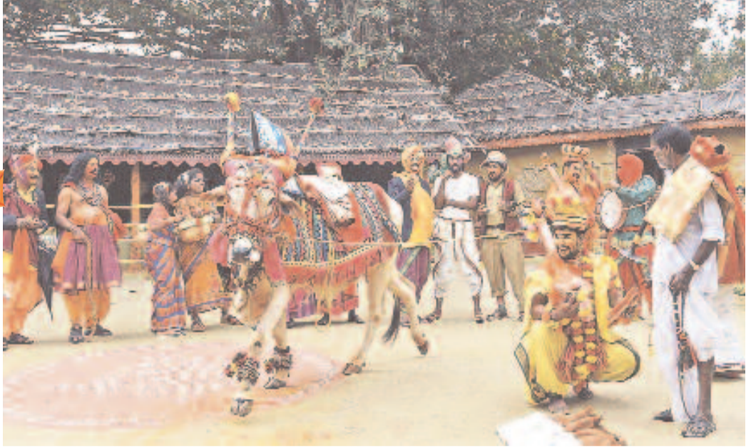
భోగి భాగాల భోగితో సంక్రాంతి సంబంధాలు అదివారం రాష్ట్రవ్యాప్తంగా ఘనంగా ప్రారంభమయ్యాయి. పండుగ శోభతో లోగిళ్లు కళకళలాడాయి. భోగి వర్షదినాన ఊరూవాడ తెల్లవారుజామునే నందడి నెలకొన్నది. ఏడాదంతా సుఖానాతులతో ఉండాలని భోగి మంటలు వేశారు. హైదరాబాద్ శిల్పారామంలో గంగిరెద్దుతో హరిదాసులు నందడి చేశారు.