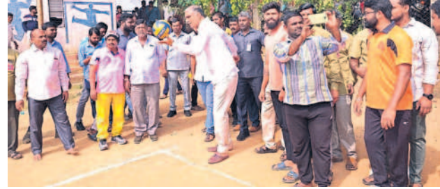
సిద్దిపేటలో ఆటో డ్రైవర్ల ఆటల పోటీలను ప్రారంభిస్తున్న ఎమ్మెల్యే హరిశ్చంద్ర

సిద్దిపేట, జనవరి 13 : ఆటో డ్రైవర్ల సమస్యలు పరిష్కరించాలి.. నెలకు రూ. 15వేల జీవనవ్యయి ఇవ్వాలని మాజీ మంత్రి, ఎమ్మెల్యే తన్నీరు హరిశ్చంద్ర ప్రభుత్వాన్ని డిమాండ్ చేశారు. సిద్దిపేట లోని జయశంకర్ స్టేడియంలో సిద్దిపేట ఆటో డ్రైవర్ కో ఆపరేటివ్ సొసైటీ అధ్యక్షులతో ఆటో డ్రైవర్లకు నిర్వహించిన ఆటల పోటీలను శనివారం ఆయన ప్రారంభించారు. ఈ సందర్భంగా ఎమ్మెల్యే హరిశ్చంద్ర మాట్లాడుతూ ఆటో డ్రైవర్ల సమస్యలపై అసెంబ్లీలో ప్రభుత్వాన్ని నిలదీస్తామన్నారు. సిద్దిపేట జిల్లా ఆటో డ్రైవర్ కో ఆపరేటివ్ సొసైటీలో 1480 మంది ఆటో డ్రైవర్లకు పట్టణాలు ఉన్నారని, పట్టణానికి వచ్చే అతిథులను గౌరవపూర్వకంగా గమ్యాన్ని అనుకూలంగా చేరుస్తున్నారని ప్రశంసించారు.