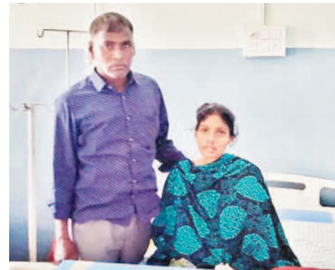
నిర్మల్ జిల్లా కేంద్రంలోని ప్రభుత్వ దవాఖానంలో చికిత్స పొందుతున్న క్రీజ