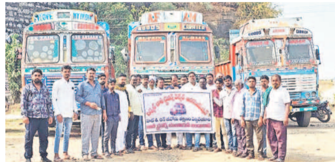
లారీలు నిలిపి ఆందోళన చేస్తున్న లాఠీ డ్రైవర్స్, లండన్ ఓనర్స్ అసోసియేషన్ సభ్యులు