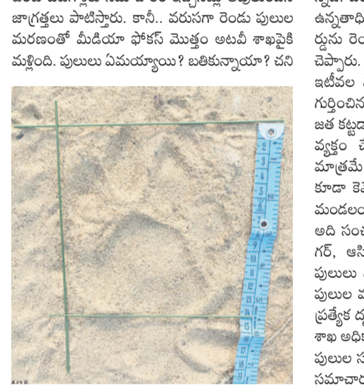
దరిగాం అటవీ ప్రాంతంలో గుర్తించిన పులి పాదముద్రలు