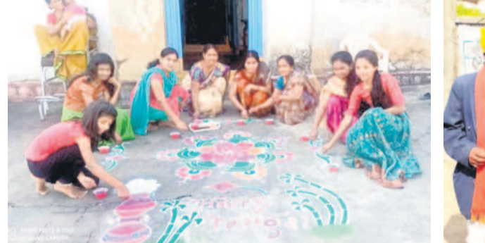
బజార్ హత్యార్ రంగురంగుల ముగ్గులు వేస్తున్న మహిళలు, యువతులు (ఫైల్)