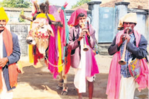
చెన్నూర్ పట్టణంలో గంగిరెద్దుల వివాహాలు (ఫైల్)