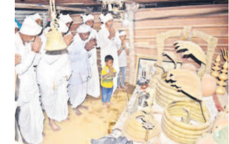
పాత నాగోబా(ముఠాడిలో) పూజలు చేస్తున్న మెన్ల వంశీయులు