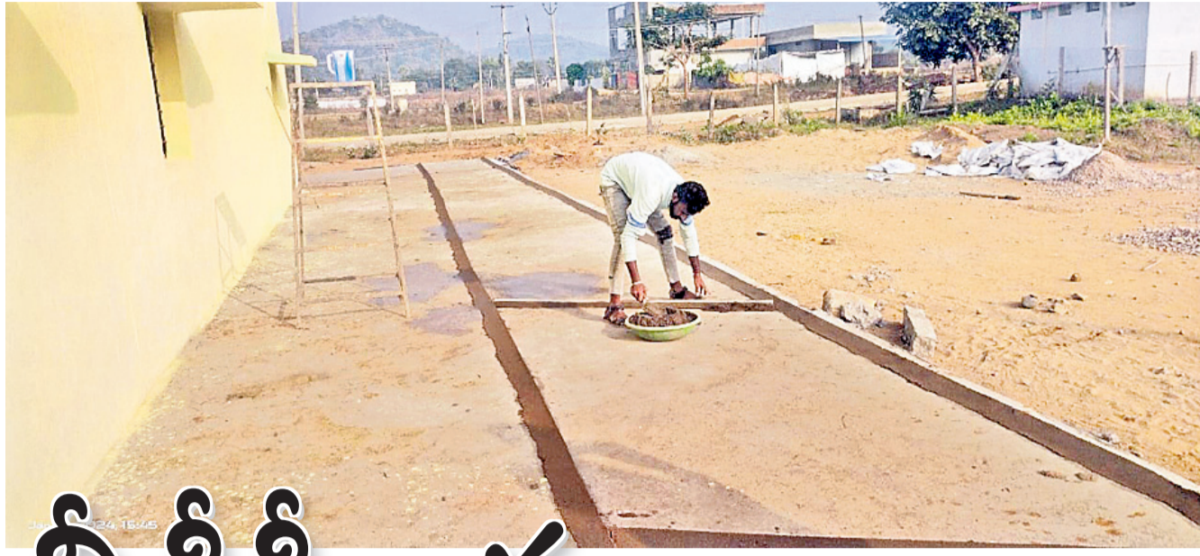
మేడారం పంచాయతీ పరిధిలో ఉన్న శానిటేషన్ భవనం వద్ద సీసీ పనులు

ములుగు, జనవరి 12 (నమస్తే తెలంగాణ) : మేడారం జాతర పరిధిలో విలేజ్ డెవలప్ మెంట్ కమిటీల అనుమతి లేకుండానే అభివృద్ధి పనులు చేపట్టడం స్థానిక గ్రామ పాలకులు, వీడిసీ సభ్యుల్లో ఆగ్రహానికి కారణమవుతున్నది. జాతర అభివృద్ధిలో నామినేటెడ్ పనులకు వీడిసీల అనుమతి తప్పనిసరి. గతంలో సర్పంచ్, పాలకర్షణ సభ్యులు, వీడిసీల అనుమతి తీసుకున్నాకే పనులు చేపట్టారు. అగ్రిమెంట్ అనంతరమే పనులు ప్రారంభించాల్సి ఉంటుంది. కానీ గిరిజన సంక్షేమ శాఖ అధికారులు ఇందుకు విరుద్ధంగా వ్యవహరిస్తూ తూతూమండ్రంగా పనులు కొనసాగిస్తున్నారన్న ఆరోపణలు వస్తున్నాయి. గ్రామాభివృద్ధికి రావాల్సిన నిధులను కాంట్రాక్టర్లకే కట్టబెట్టేలా అధికారులు వ్యవహరిస్తున్నారని, పంచాయతీల అనుమతి, వీడిసీల ప్రమేయం లేకుండానే పనులు చేసేందుకు సిద్ధమయ్యాడని, వీడిసీ అనుమతి లేదే బిల్లులు ఇవ్వచ్చు అన్న నిబంధన ఉన్నా అధికారులు, కాంట్రాక్టర్ల వట్టింపుకోవడం లేదనే విమర్శలు వెల్లువెత్తుతున్నాయి.