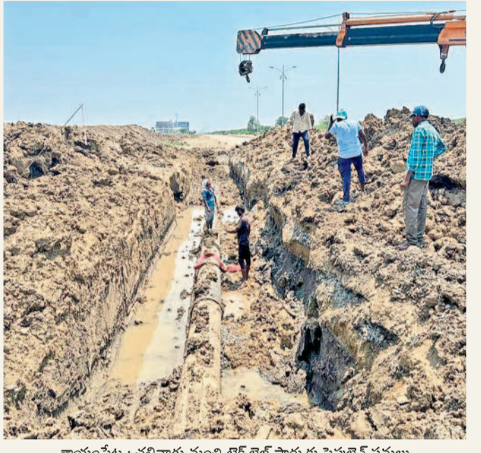
శాయంపేట : చలివాగు నుంచి ట్రిక్లైల్ పారుకు పైపులైన్ పనులు

మంత్రి కొండా సురేఖ వరంగల్, జనవరి 12 (నమస్తే తెలంగాణ): భావితరాలకు నివాసయోగ్యమైన పరిసరాలను అందించడం మనందరి బాధ్యతని రాష్ట్ర అటవీ, పర్యావరణ, దేవాదాయ శాఖల మంత్రి కొండా సురేఖ అన్నారు. వ్యవసాయం పెంపుకు ఎంతగా ప్రాధాన్యం ఇస్తున్నామో నిత్య జీవితంలో ప్లాస్టిక్ వాడకాన్ని కూడా పీల్చినంతగా తగ్గించాలని ఆమె విజ్ఞప్తి చేశారు. ఈ మేరకు మంత్రి శుభ్రవారం ఒక వీడియో సందేశాన్ని విడుదల చేశారు. సింగిల్ యూజ్ ప్లాస్టిక్ వల్ల అనేక అనర్ధాలు ఉన్నాయని, అవ