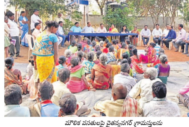
మౌలిక వసతులపై చైతన్యగర్ గ్రామస్థలను అడిగి తెలుసుకోవాలి, జిల్లా అదనపు కలెక్టర్ లింగాయక్

ఈ నెల 15న చైతన్యగర్లో పీఎం జన్మన్ కార్యక్రమం ప్రతి లబ్ధిదారుడు, కుటుంబానికి సంక్షేమ ఫలాలు, వసతుల కల్పన ఈ నెల 15న అన్ని శాఖల అధికారులు కార్యక్రమంలో పాల్గొనాలి సంక్రాంతి పండుగను సెలవుదినంగా భావించకూడదు ఆయా శాఖల అధికారులతో జిల్లా అదనపు కలెక్టర్ లింగాయక్ సమీక్షా సమావేశం పెద్దమ్మల్, జనవరి 12 : చెంచు జాతి ప్రజల జీవనోపాధి కోసం ప్రభుత్వం కృషి చేస్తున్నదని, ఈ నెల 15న 'పీఎం జన్మన్' కార్యక్రమాన్ని నిర్వహిస్తున్నట్లు జిల్లా అదనపు కలెక్టర్ లింగాయక్ తెలిపారు. శుక్రవారం మండలంలోని చైతన్యగర్ గ్రామంలో అధికారులతో కలిసి మౌలిక వసతుల కల్పనపై సమీక్షించారు. ఈ సందర్భంగా అదనపు కలెక్టర్ మాట్లాడుతూ ఈ నెల 15న ప్రధాన మంత్రి నరేంద్రమోదీ ప్రజలనుద్దేశించి మాట్లాడి కార్యక్రమంలో విద్యుత్ అంతరాయం ఏర్పడకుండా చూడాలని సంబంధిత అధికారులను ఆదేశించారు. చైతన్యగర్ గ్రామంలో ప్రతి వ్యక్తి కుటుంబానికి ఆధారకార్డు, విద్యుత్, ఇంటింటికీ నల్ల కవచ్చు, ఇన్ డన్ ఆకౌంట్లు, బ్యాంకు ఖాతాలు, కల డ్రుమీకరణ పత్రాలు, పీఎం కిసాన్ క్రెడిట్ కార్డులు, ఆయు