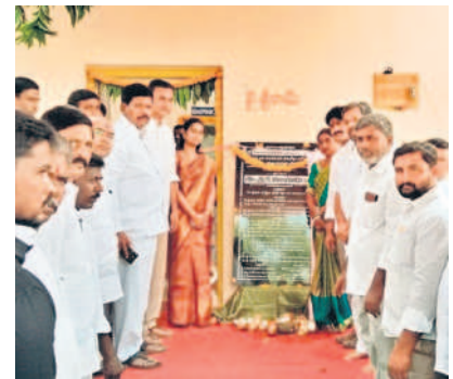
జీపీ భవనాన్ని ప్రారంభిస్తున్న ఎమ్మెల్యే, ఎమ్మెల్యే

2వ ఫెస్ట్ 5 సీనియర్ నేషనల్ నెట్ బాల్ ఛాంపియన్ షిప్ దేశవ్యాప్తంగా 28 రాష్ట్రాల నుంచి 720 మంది క్రీడాకారులు తలపెట్టుతున్నారు. తెలంగాణ, ఆంధ్రప్రదేశ్, తమిళనాడు, కర్ణాటక, కేరళ, పుదుచ్చేరి, అరుణాచల్ ప్రదేశ్, అస్సాం, బీహార్, చత్తీ