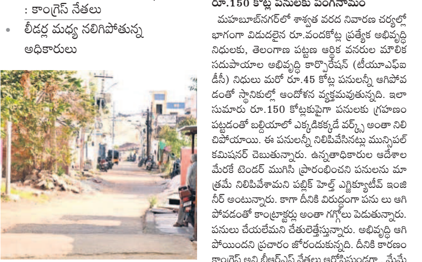
మున్సిపాలిటీలో నిలిపివేయిన సీసీ రోడ్డు పనులు