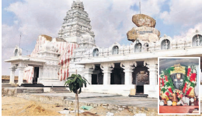
అప్పాజిపల్లిలోని లక్ష్మీనర్సింహస్వామి ఆలయం, (ఇన్సెట్) స్వామి మూల విరాట్