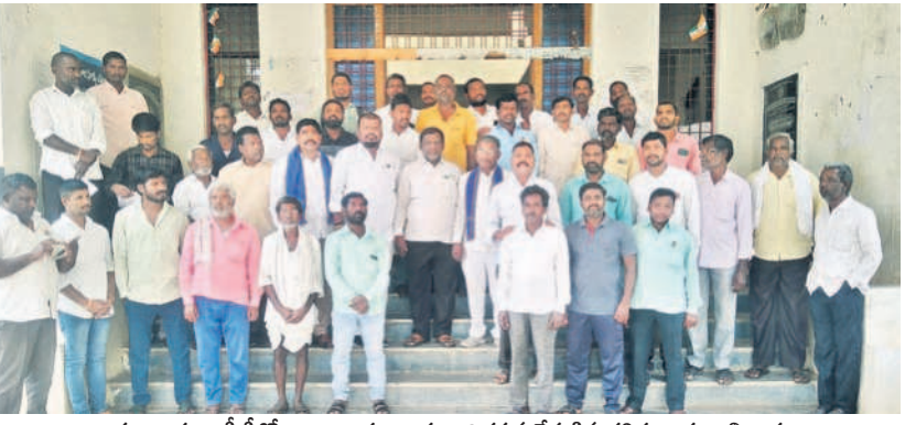
హన్మడ ఎంపీడీవో కార్యాలయం ఎదుట నిరసన చేపట్టిన దళితబంధు అభ్యర్థులు

2022లో వచ్చిన వరదలతో మున్సిపాలిటీలోని లోతట్లు ప్రాంతాలు జలమయమయ్యాయి. పట్టణం విస్తరిస్తున్నా జైనేజీ వ్యవస్థ సరిగా లేకపోవడంతో వరద తీసుకువచ్చిన ప్రచారం జోరందుకున్నది. దీనికి కారణం కాంగ్రెస్ అని టీఆర్ఎస్ నేతలు ఆరోపిస్తుండగా.. మేమేమి ఆపలేదని ఆ పార్టీ నాయకులు చెబుతున్నారు. ఈ