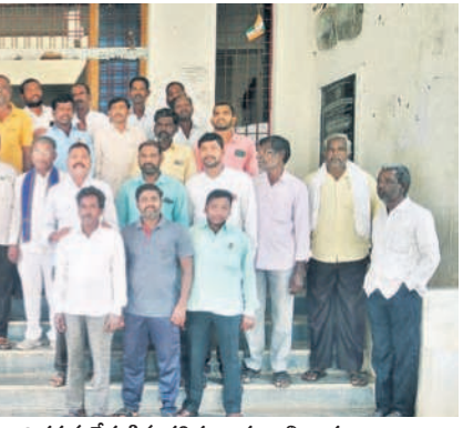
హన్మడ ఎంపీడీవో కార్యాలయం ఎదుట నిరసన చేపట్టిన దళితబంధు అభ్యర్థులు

అధికార పార్టీ నాయకులు మహబూబ్ నగర్ మున్సి పాలిటీపై పట్టుకోసం ప్రయత్నిస్తున్నారు. ఇందులో భాగంగా జిల్లా కేంద్రం డెవలప్ మెంట్ కు సంబంధించిన కార్యక్రమాలు తాము చెప్పినట్లు ప్రారంభించాలని, మళ్ళీ కొత్తగా శంకుస్థాపనలు చేసేందుకు ప్రాస్తు వేస్తున్నారని తెలిసింది. కేసీఆర్ ప్రభుత్వంలో మంజూరై బండ్రు పూర్వయ్య పనులు ప్రారంభమయ్యారక సగం లోనే కొన్ని ఆపడం, ప్రారంభం కాని పనులను కూడా ఆపమని హుకుం జారీ చేయడం ఎంతవరకు సమంజ సమని టీఆర్ఎస్ నేతలు ప్రశ్నిస్తున్నారు. కాగా మున్సి పాలిటీపై పూర్తిస్థాయిలో పట్టు సాధించేందుకు కొందరు కొన్ని లక్షల ఎరగా వాడుకొని అధికారాన్ని చేజిక్కించు కునేందుకు కాంగ్రెస్ ప్రయత్నిస్తుండగా దీన్ని చివలం చేసేందుకు టీఆర్ఎస్ పావులు ఉడుపుతున్నది.