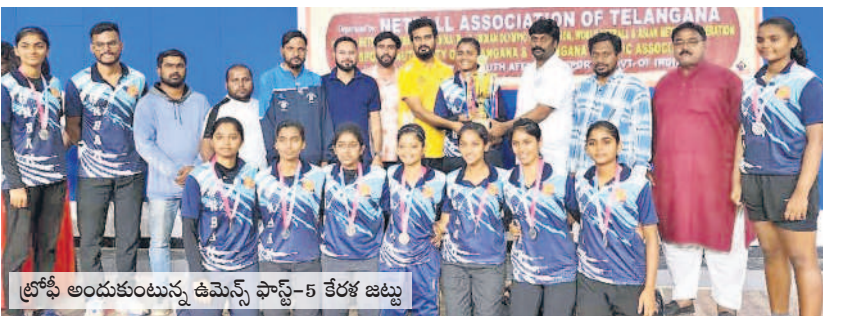
డ్రోసీ అందుకుంటున్న ఉమ్మెన్ ఫాస్ట్-5 కేరళ జట్టు