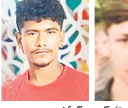
సమీర్, అనాన్ (ఫైల్)

వినియోగదారుల/ భిక్కునూరు, జనవరి 12: ఉమ్మడి జిల్లాలో తీవ్ర విషాదం చోటుచేసుకుంది. శుక్రవారం సాయంత్రం జరిగిన వేర్వేరు రోడ్డు ప్రమాదాల్లో నలుగురు దుర్మరణం చెందగా.. ఇద్దరు తీవ్రంగా గాయపడ్డారు. గాయపడినవారిని దవాఖానకు తరలించగా.. చికిత్స పొందుతున్నారు. నిజామాబాద్ నగర శివారులోని నెహ్రూనగర్ పరిధిలోని అశోక్ నాగర్ వద్ద జరిగిన రోడ్డు ప్రమాదంలో ఇద్దరు యువకులు మృత్యువాత