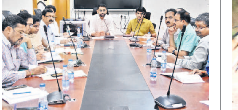
అధికారులతో మాట్లాడుతున్న కామారెడ్డి కలెక్టర్ జితేష్ వీ పాటిల్

నాటి ప్రతి మొక్కనూ సంరక్షించాలి కామారెడ్డి కలెక్టర్ జితేష్ వీ పాటిల్