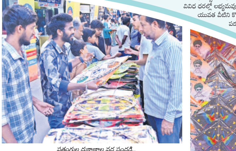
పతంగుల దుకాణాల వద్ద సందడి..