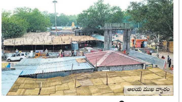
అలయ ముఖ ద్వారం

టిక్ టైల్ పారుకు గొదావరి జలాల శాయంపేట, జనవరి 12 : శాయంపేట మండలం కోగంపల్లి శివారు చలివారు బ్యాకెన్సింగ్ రిజర్వాయర్ నుంచి కాకతీయ మెగా టిక్ టైల్ పారుకు గొదావరి జలాల తరలింపు రెండు నెలల్లో మొదలు కానున్నట్లు అధికారులు తెలిపారు. కేసీఆర్ ప్రభుత్వం అత్యంత ప్రతిష్టాత్మకంగా ఏర్పాటు చేసిన టిక్ టైల్ పారుకు చలివారు నుంచి నీరందించేందుకు రూ. 100 కోట్లతో పనులు చేపట్టారు. టిక్ టైల్ పారుకులో సందేహాల్పాకా (ట్రీట్ మెంట్) ఫ్యాంట్ పనులు కొనసాగుతున్నాయి. కాంట్రాక్ట్ గడువు ఈ నెల వరకే ఉండగా మరో ఆరు నెలలు పొడిగించారు. పారుకు విటా 0.168