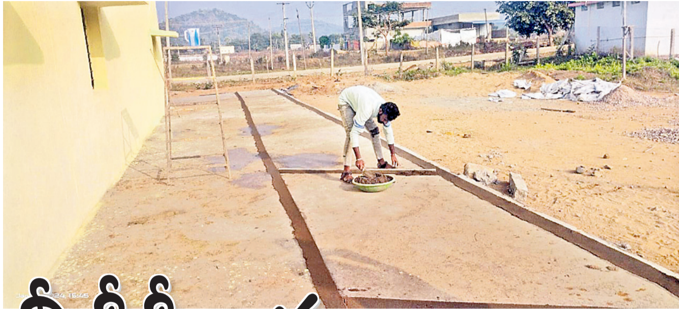
మేడారం పంచాయతీ పరిధిలో ఉన్న శానిటేషన్ భవనం వద్ద సీసీ పనులు

మంత్రి కొండా సురేఖ వరంగల్, జనవరి 12 (నమస్తే తెలంగాణ): భావితరాలకు నివాసయోగ్యమైన పరిసరాలను అందించడం మనందరి బాధ్యతని రాష్ట్ర అటవీ, పర్యావరణ, దేవాదాయ శాఖల మంత్రి కొండా సురేఖ అన్నారు. వ్యవసాయం పెంపుకు ఎంతగా ప్రాధాన్యం ఇస్తున్నామో నిత్య జీవితంలో ప్లాస్టిక్ వాడకాన్ని కూడా పీల్చినంతగా తగ్గించాలని ఆమె విజ్ఞప్తి చేశారు. ఈ మేరకు మంత్రి శుభ్రవారం ఒక వీడియో సందేశాన్ని విడుదల చేశారు. సింగిల్ యూజ్ ప్లాస్టిక్ వల్ల అనేక అనర్ధాలు ఉన్నాయని, అవ