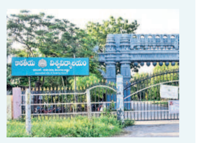
కేయాలో అక్రమాలపై యూజీసీ ఆరా

గొల్లకురుమల ఇలవేల్పు సుమారు పది అడుగుల ఎత్తుతో విశాల నేత్రాలు, కోరమీసాలతో చతుర్ముఖులలో ఐదం, త్రిశూలం, ధనుర్వక్రం, పణాపాత్రలతో