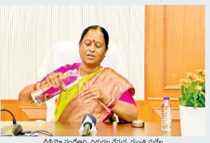
వీడియో సందేశాన్ని విడుదల చేస్తున్న మంత్రి సురేఖ