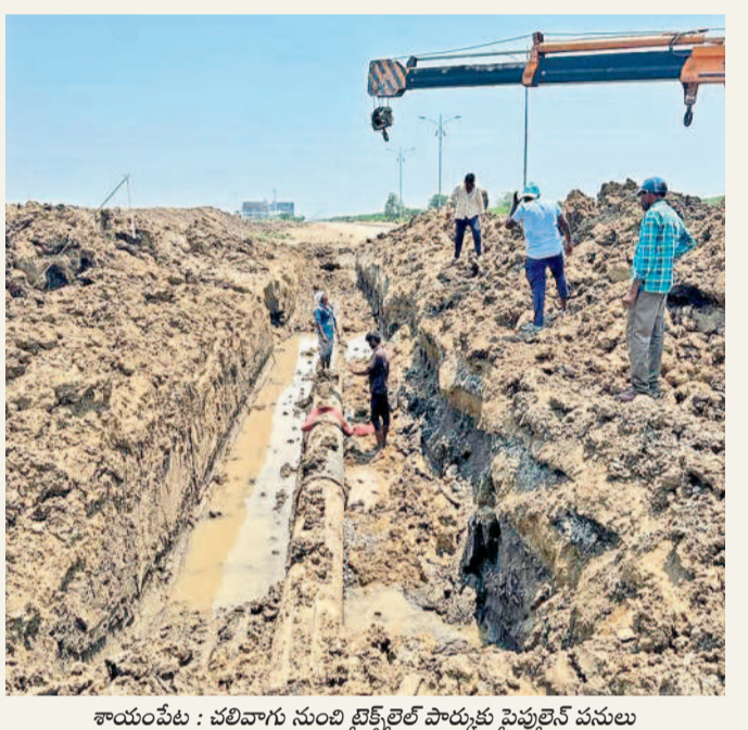
శాయంపేట : చలివారు నుంచి ట్రాక్టర్లతో పారుతున్న పైపులైన్ పనులు