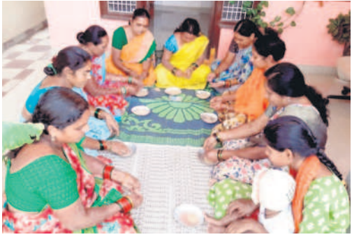
వడ్డను గోటితో ఒలుస్తూ మహిళలు

మెట్పల్లి మారుతీనగర్, జనవరి 11: భద్రాచలం రాములోర్ కల్యాణానికి ఏటా మెట్పల్లికి చెందిన మహిళలు వడ్డను గోటితో ఒలిచిన బియ్యన్ను సిద్ధం చేయడం ఆనవాయితీ. ఇది సంప్రదాయాన్ని కొనసాగిస్తూ గురువారం పట్టణంలోని బాలకృష్ణనగర్లోని మహిళలు వడ్డను చేతితో ఒలుస్తూ కనిపించారు. ఈ నెల 15న తలంబ్రాలను భద్రాచలానికి పంపిస్తామని వారు చెప్పారు.