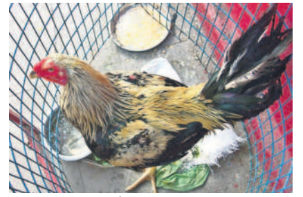
కరీంనగర్లోని ఆర్టీసీ డిపో-2 ఆవరణలో నెక్యూట్ గార్డల్ పర్యవేక్షణలో పంపించి కోడి