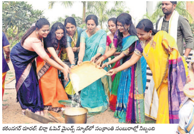
కరీంనగర్ రూరల్: బిర్లా ఓపెన్ మైండ్ స్కూల్లో సంక్రాంతి సంబంధాల్లో నిర్వహించిన కార్యక్రమం