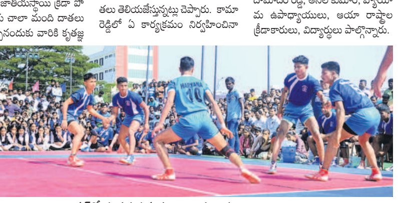
పైనేలో తలవదుతున్న హార్వానా, కర్ణాటక జట్లు