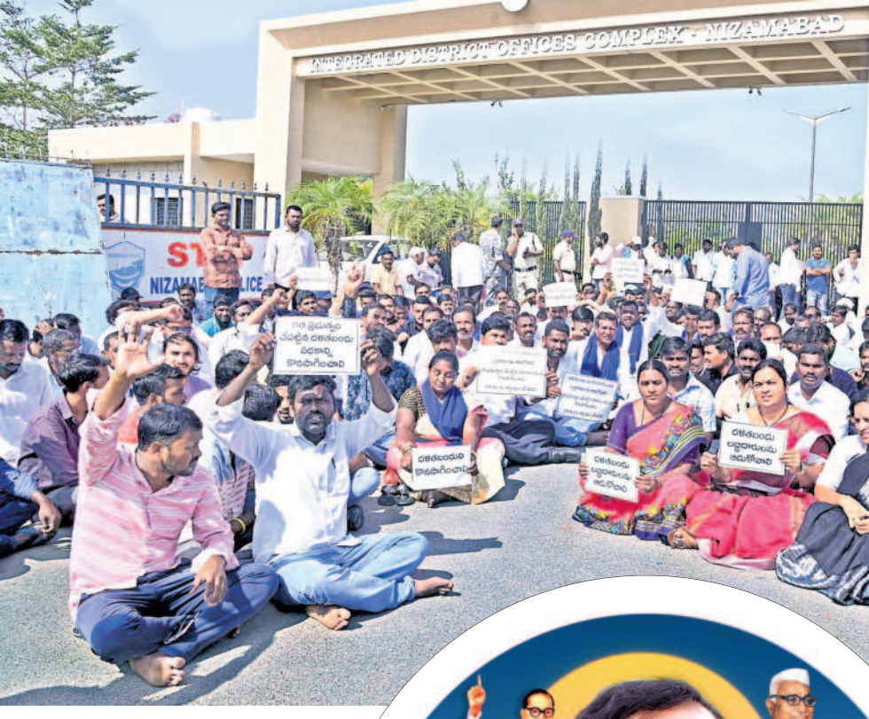
కలెక్టరేట్ గేటు ఎదుట ఆందోళన చేస్తున్న దళితబంధు లబ్ధిదారులు