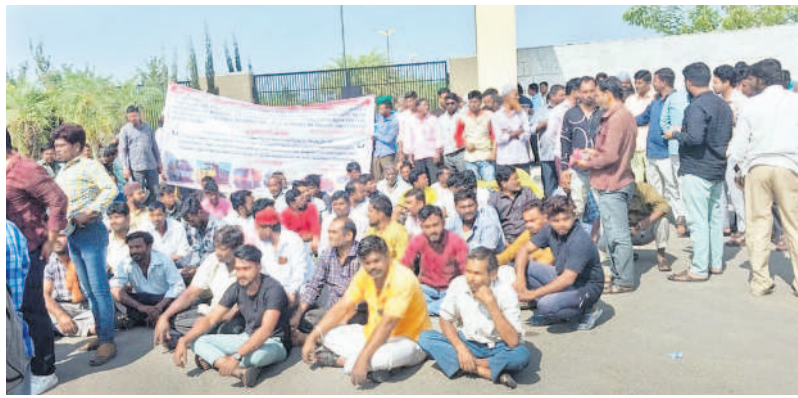
నిజామాబాద్ కలెక్టరేట్ ఎదుట ధర్నా చేస్తున్న లాల్ డైవర్స్ క్లబ్ సభ్యులు