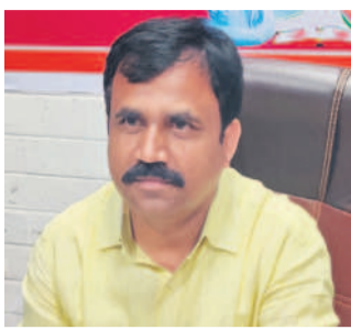
మోవీం అంగారానాయక్ గంజాయి చాక్లెట్లను స్వాధీనం చేసుకున్న పోలీసులు