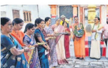
గరిడేపల్లి : పానుగోడు వేణుగోపాల స్వామి దేవాలయంలో పూజలు చేస్తున్న భక్తులు

స్వామి, కల్వరెడ్డిలోని శ్రీదేవి, భూదేవి సమేత వేంకటేశ్వర స్వామి దేవాలయంలో మండలంలో 25 రోజు ధనుర్మాసోత్సవాలు కొనసాగాయి. ఈ సందర్భంగా మహిళలు పెద్ద సంఖ్యలో ఆయా దేవాలయాలకు వెళ్లి పూజలు చేశారు.