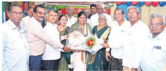
కోదాడలోని పెన్షనర్ల భవన్లో ఎమ్మెల్యే పద్మావతికి పుష్పగుచ్ఛం అందజేస్తున్న విశ్రాంత ఉద్యోగులు