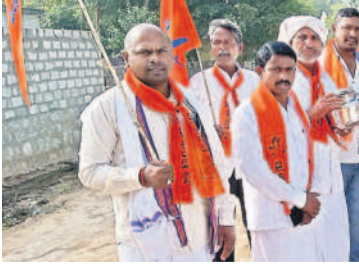
సూర్యాపేట రూరల్ : ఇమాంపేటలో అక్షింతల పంపిణీ చేస్తున్న భక్తులు