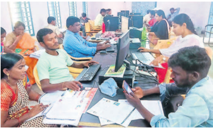
మతంపల్లి : ఎంపీడిఓ కార్యాలయంలో దరఖాస్తులను ఆన్లైన్ చేస్తున్న సిబ్బంది