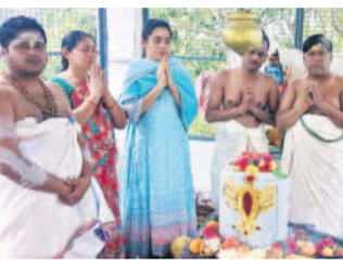
ఉండ్రగొండ ఉమామహేశ్వర ఆలయంలో రుద్రాభిషేకం చేస్తున్న అధ్యక్షులు