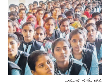
యువ సమ్మేళనంలో పాల్గొన్న విద్యార్థులు