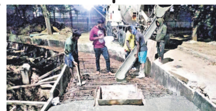
కేబీఆర్ స్టేడియంలో జరుగుతున్న బాక్స్ ట్రైవ్ డ్రైన్ స్టాబ్లీ పనులు

జూబ్లీహిల్స్, జనవరి 10: ఎన్నికల సేవలకు తో ఆగిపోయిన అభివృద్ధి పనులు కొత్త ప్రభుత్వం కొలువుదీరాక వేగం పుంజుకున్నాయి. పాపంపేట ఎన్నికల స్టేషన్ ముందుకొస్తున్న దశలో అభివృద్ధి పనులు చురుకుగా చేయించడంలో అధికారులు దృష్టి సారించారు. వద్ద బస్టాండ్ లో రోడ్డు దాటుతుండగా, వేగంగా వచ్చిన క్యాబ్ డ్రీకానింది. దీంతో ఆమె తల, ముఖం, కాళ్లు, చేతులకు తీవ్ర గాయాలయ్యాయి. సదరు క్యాబ్ డ్రైవర్ ఆమెను స్పైవేల్ దవాఖానంలో చేర్చించగా, చికిత్స అందిస్తున్నారు. కేసు నమోదు చేసి దర్యాప్తు చేస్తున్నట్లు పోలీసులు తెలిపారు.