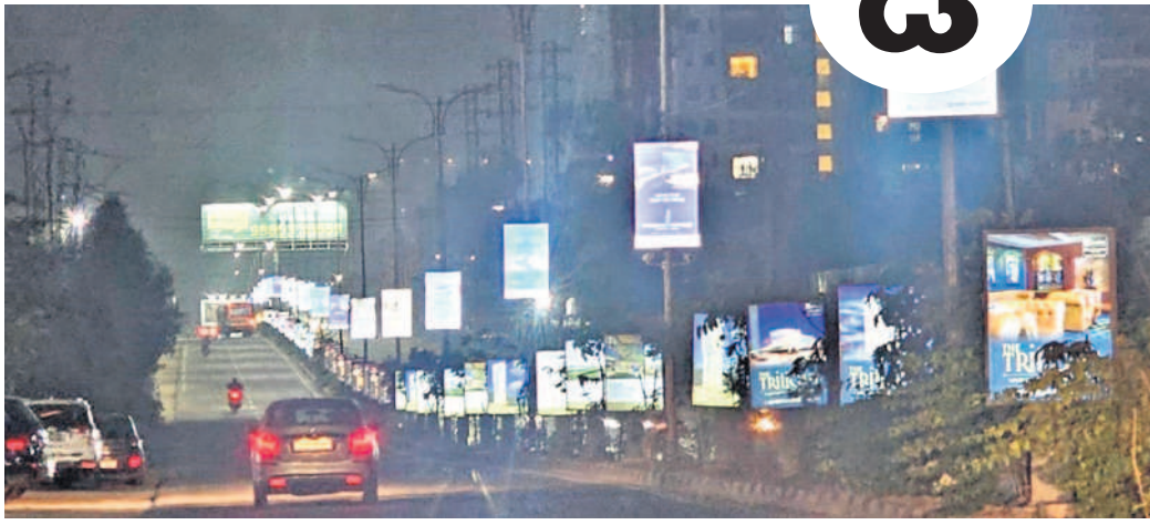
గండ్లపేట వారిపల్లి వద్ద అనుమతి లేకుండా అడుగుకొట్టి చొప్పున ఏర్పాటు చేసిన మిసి హోల్డింగులు

మున్సిపాలిటీలో గత కొన్నాళ్లగా ఓ కాంట్రాక్టర్ అటు అధికారులు, ఇటు పాలక వర్గానికి రింగ్ మ్యాస్టర్లు వ్యవహారాన్ని అన్ని దశల్లో నడుపుతున్నట్లు ఆరోపణలున్నాయి. ఓ వైపు సివిల్ కాంట్రాక్టర్ పనులు చేస్తూ అక్కడ నాణ్యతా ప్రమాణాలను పాటించకుండా.. ఇప్పుడు కాజాగా హోల్డింగుల జాతరలో అను