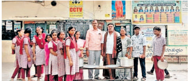
ముణికోడ ప్రభుత్వ పాఠశాలలో విద్యార్థులకు అర్హతపరం అందజేస్తున్న దృశ్యం