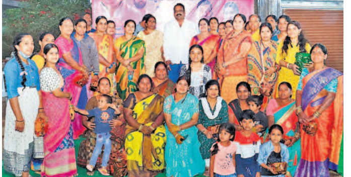
లక్ష్మీగూడలో నిర్వహించిన ముగ్గుల పోటీల్లో విజేతలతో ఎమ్మెల్యే టి.ప్రకాశ్ గౌడ్