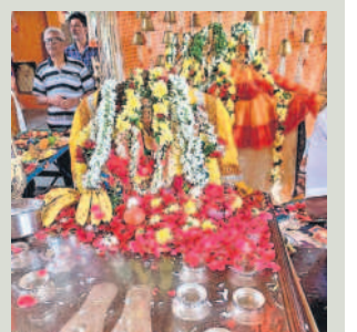
భోరబండ సాయిబాబా అలయంలో అయోధ్య రామయ్య పాదుకలు

ఎర్రగడ్డ, జనవరి 10: అయోధ్య రామయ్య పాదుకలు బుద్వారం భోరబండలో దర్శనమిచ్చాయి. పీఠాధిపతులు, వేద పండితులు ఓ ప్రత్యేక హాహునంలో ఉదయం 10 గంటలకు భోరబండ బస్టాండ్ వద్ద ఉన్న దేవాలయ శాఖకు చెందిన సాయిబాబా ఆలయ ప్రాంగణానికి తీసుకొచ్చారు. ఆలయ అర్చకులు, పెద్దలు కలిసి మీసీ మండ పాస్ని ఏర్పాటు చేసి రాములవారి పాదుకలను పక్కల దర్శనార్థం అందుబాటులో ఉంచారు. దీంతో పక్కలు తరలి వచ్చి ప్రత్యేక పూజలు చేసి పాదుకలను దర్శించుకొన్నారు. అనంతరం ఆ పాదుకలను మోతీనగర్ లోని శృంగేరి శంకర మఠానికి తీసుకొచ్చారు.