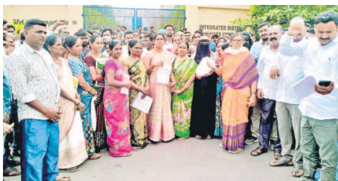
కలెక్టరేట్ ఎదుట ఆందోళన చేస్తున్న గృహలక్ష్మి లబ్ధిదారులు