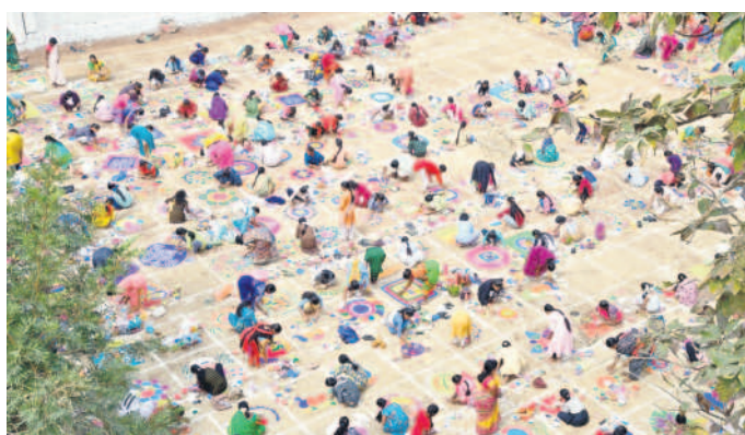
కరీంనగర్ డెయిలీ ఆవరణలో ముగ్గులు వేస్తున్న మహిళలు