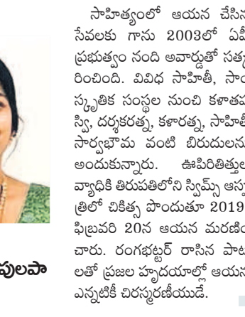
సాయి లోపాత పులపా

సాహిత్యంలో ఆయన చేసిన సేవలకు గాను 2003లో పీఠీ ప్రభుత్వం నంది అవార్డుతో సత్కరించింది. వివిధ సాహితీ, సాంస్కృతిక సంస్థల నుంచి కళాశాసన్స్, దర్శకత్వ, కళారత్న, సాహితీ సార్వభౌమ వంటి బిరుదులను అందుకున్నారు. ఊపిరితిత్తుల వ్యాధికి తిరుపతిలోని స్వీమ్స్ ఆస్పత్రిలో చికిత్స పొందుతూ 2019, ఫిబ్రవరి 20న ఆయన మరణించారు. రంగభట్లర్ రాసిన పాటలతో ప్రజల హృదయాల్లో ఆయన ఎన్నటికీ చిరస్మరణీయుడే.