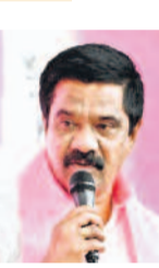
కాంగ్రెస్ ప్రభుత్వ విధానమా?