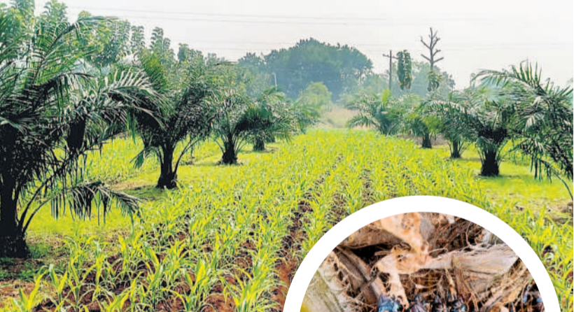
గుంటూరుపల్లిలో ఆయిల్ పాం మొక్కలకు వేసిన గెలలు

ప్రత్యామ్నాయంపై దృష్టిపెట్టిన రైతులు ప్రయోగాత్మకంగా సాగుచేసిన ఆయిల్ పాం పంట కాకకు వచ్చింది. మాదేశ్ క్షేత్రం ఎన్నో ఆశలతో నాటిన మొక్కలు పెద్దదై దిగుబడి మొదలవడంతో రైతుల్లో సంతోషం వెల్లివిరిసింది. గత కేసీఆర్ సర్కారు ప్రోత్సాహం, సబ్సిడీ అందించడంతో జిల్లాలో మొదటి విడుత 352.55 ఎకరాల్లో పంట సాగుచేయగా, ఇప్పటివరకు 3044 ఎకరాల్లో పంట సాగుచేయింది. అంతేకాక ఆయిల్ పాం తోటల మధ్యలో అంతర పంటతోనూ అదనపు ఆదాయం పొందుతూ లాభాల పంటలు పండిస్తున్నారు.