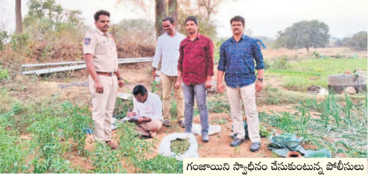
గంజాయిని స్వాధీనం చేసుకుంటున్న పోలీసులు

మానవహదు మండలంలో విస్తారంగా మిరప సాగు సాగునీరందక అన్నదాతల అవస్థలు కాపుడలో నీటి సరఫరా బండ్ క్రావ్ హాలీడే ప్రకటించిన అధికారులు మానవహదు, జనవరి 7 : ఒకవైపు కుంగడ్రానంది, మరోవైపు కృష్ణానది, జూరాల, అల్లపల్లి, తుమ్మిళ్ల లిప్తి డ్యాంు సాగునీరు అందుకుండానే ఉద్దేశంతో రైతులు మండలం అయిన గ్రామాల్లో మిరప పంటను విస్తారంగా సాగు చేశారు. టీటీ డ్యాంు, జూరాల రిజర్వాయర్ లో నీరు లేకపోవడంతో అధికారులు పంటలకు సాగునీరు లేకుండానే మిరప రైతులకు సాగునీరు లేక కన్నీళ్లు విగల్గుతున్నాయి. మానవహదు మండలంలోని 17 గ్రామాల్లో సుమారు 11,700 ఎకరాల్లో మిరప, 2 వేల ఎకరాల్లో కంది, 400 ఎకరాల్లో మొక్కజొన్న, జొన్న పంటలను సాగు చేశారు. ఏటా జనవరి వరకు సాగునీరు అందుకుండానే దీనిని దృష్టిలో ఉంచుకొని వాసకాలంలో మిరప పంటను విస్తారంగా సాగు చేశారు. పర్వాల ప్రభావం వల్ల మిరప పంటను విస్తారంగా సాగు చేశారు. పర్వాల ప్రభావం వల్ల మిరప పంటను విస్తారంగా సాగు చేశారు.