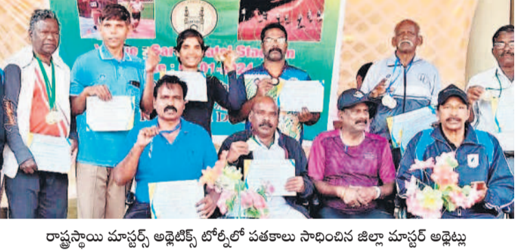
రాష్ట్రస్థాయి మాస్టర్స్ అథ్లెటిక్స్ టోర్నీలో పతకాలు సాధించిన జిల్లా మాస్టర్స్ అథ్లెట్లు

తగ్గిన యాసంగి సాగు.. గతేడాదిలో పోల్డర్ ప్రస్తుత యాసంగి సాగు జిల్లాలో సాగునీ మంచి తగ్గిపోయింది. ఇందుకు రైతు బంధు సాయం సకాలంలో అందకపోవడంతో పాటు ప్రభుత్వం సీజని నిలిపివేయడం.. పర్వాల ప్రభావం కూడా ఓ కారణంగా చెబుతున్నారు. పోయిన యాసంగిలో 2,14,207 ఎకరాల్లో సాగుబడులు జరిగాయి. ప్రస్తుత యాసంగి సీజన్ వారీగా మాస్తే.. ఇప్పటివరకు 34,081 ఎకరాల్లో సాగు జరిగినట్లు వ్యవసాయాఖ్య లెక్కలు చెబుతున్నాయి. ఇంతలా ఒకేసారి రైతులను సేద్యానికి దూరం కావడం పలు అసమానాలకు దారితీస్తుంది. ఆర్థిక పరిస్థితుల నుంచి రైతులు గట్టెక్కాలంటే ప్రభుత్వ ప్రోత్సాహం తప్పనిసరి అందాలి. ఈ క్రమంలో రైతు బంధు సాయం వెనక్కి.. ముందుకు అవుతుండడంతో అన్నదాతలు ఆందోళనకు గురవుతున్నారు. ఎన్నికలకు ముందే అందుతుండనుకున్న యాసంగి పెట్టుబడి వాయిదాలు పడుతూ మరింత దూరంగా వెళ్తున్నట్లు కనిపిస్తుంది. రైతులను ఎదురు చూపులు ఎండవూపులు కాకుండా ఉండాలంటే.. కాంగ్రెస్ సర్కారు వెంటనే రైతు బంధు పెట్టుబడులను అన్నదాతల ఖాతాల్లో జమ చేయడం ద్వారానే ఉపశమనం పొందే అవకాశం ఉన్నది.