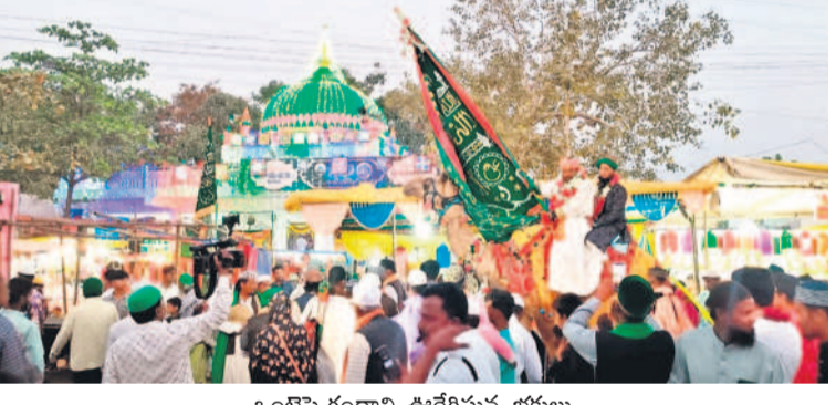
ఓంకొత్త గండ్లపాటి ఊరేగిస్తున్న భక్తులు