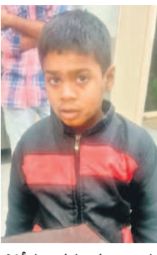
పోలీసుల వద్ద ఉన్న బాలుడు