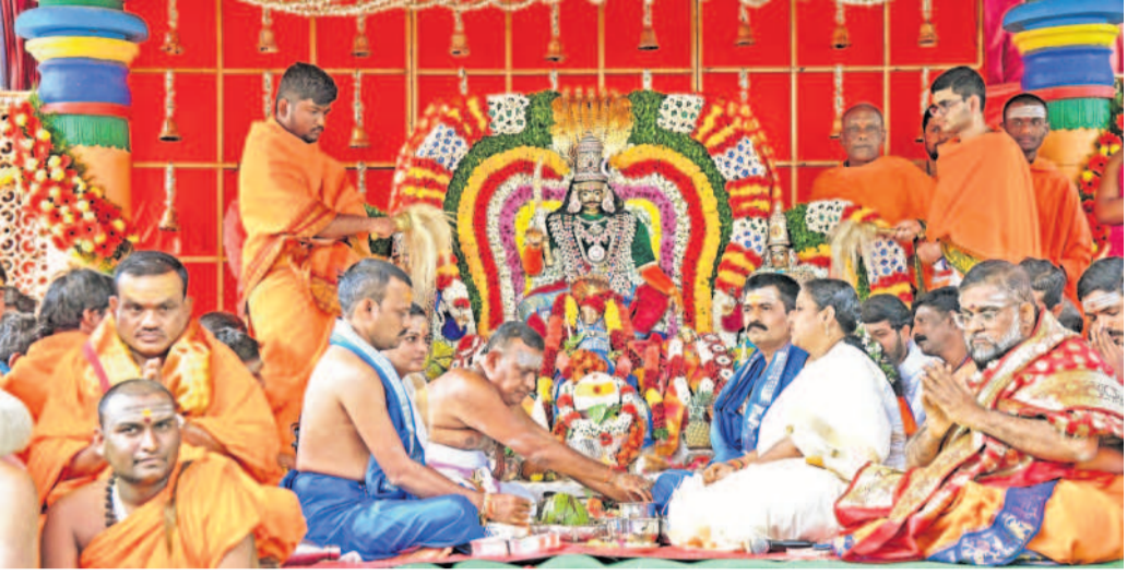
కల్యాణం జరుపుతున్న అర్చకులు

■ కాంగ్రెస్ ప్రభుత్వ విధానాలను ఎండగట్టాలి ■ బీఆర్ఎస్ శ్రేణులకు మాజీ మంత్రి ఎర్రబెల్లి పిలుపు పాలకర్షి రూరల్, జనవరి 7: పచ్చే పార్లమెంట్ ఎన్నికలకు బీఆర్ఎస్ శ్రేణులు సమాయత్తం కావాలని, కాంగ్రెస్ ప్రభుత్వ విధానాలను ప్రజలకు వివరించి ఎండగట్టాలని మాజీ మంత్రి ఎర్రబెల్లి దయాకరరావు పిలుపునిచ్చారు. ఆదివారం మండల కేంద్రంలోని పాత్రో కార్యాలయంలో బీఆర్ఎస్ శ్రేణులతో పార్లమెంట్ ఎన్నికలపై సమీక్ష సమావేశం నిర్వహించారు. ఈ సందర్భంగా ఎర్రబెల్లి మాట్లాడుతూ రాజకీయాల్లో గెలుపు ఓటములు సహజమన్నారు. ఈ విషయంలో నాయకులు అధ్యక్షుల బహుమతిని సూచించారు. ప్రజలకు మాయమాటలు చెప్పి అధికారంలోకి వచ్చిన కాంగ్రెస్ ప్రభుత్వం ఇచ్చిన హామీ మేరకు ఆరు గ్యారంటీలను తప్పిపోయిన అమలు చేసేలా చర్యలు తీసుకోవాలన్నారు. నిధుల కొరత పేర జాప్యం చేస్తే ఊరుకోవద్దన్నారు. ప్రజాపాలన భరణాన్ని విషయంలో ప్రజల సుఖం పన్నుల అధికారాలపై ఒక తీరని. పార్లమెంట్ ఎన్నికల వరకు ఏదీ జరగకపోతే, జడ్పీ కోఆర్డినేషన్ సభ్యులు ఎంపీలను దాట వేసేలా ప్రభుత్వం యోచిస్తోందని ఎర్రబెల్లి విమర్శించారు. బీఆర్ఎస్ ప్రభుత్వం