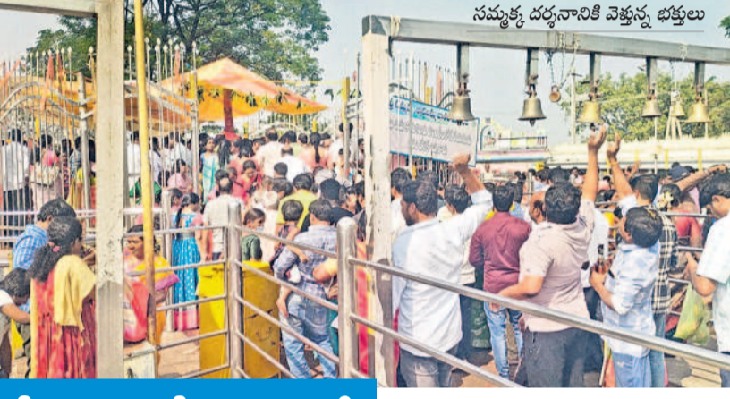
సమృద్ధి దర్శనానికి వెళ్తున్న భక్తులు