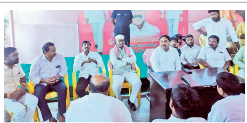
సమావేశంలో మాట్లాడుతున్న మాజీ మంత్రి ఎర్రబెల్లి దయాకరరావు