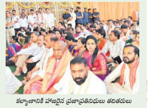
కల్యాణానికి హాజరైన ప్రజాప్రతినిధులు తదితరులు