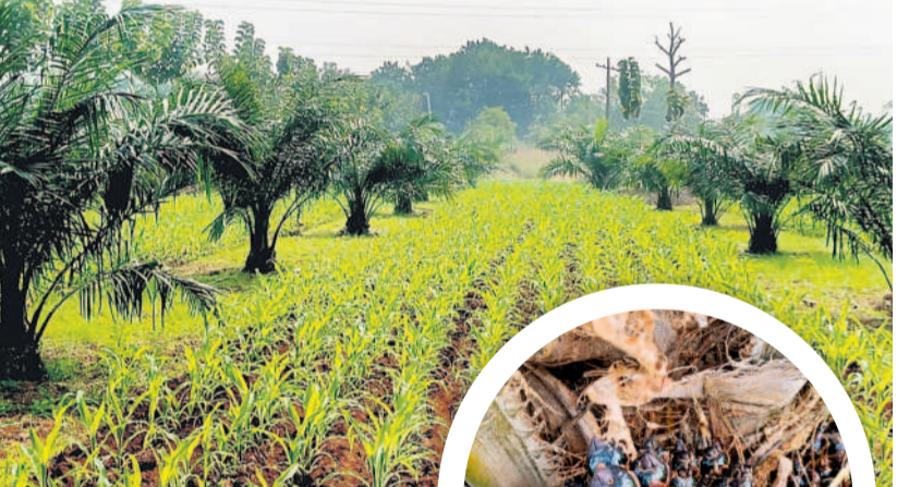
గుంటూరుపల్లిలో ఆయిల్ పాం మొక్కలకు వేసిన గెలలు

ప్రత్యామ్నాయంపై దృష్టిపెట్టిన రైతులు ప్రయోగాత్మకంగా సాగుచేసిన ఆయిల్ పాం పంట కాకకు వచ్చింది. మాదేశ్ క్షేత్రం ఎన్ఎస్ఐ ఆశలతో నాటిన మొక్కలు పెద్దదై దిగుబడి మొదలవడంతో రైతుల్లో సంతోషం వెల్లివిరిసింది. గత కేసీఆర్ సర్కారు ప్రోత్సాహం, సబ్సిడీ అందించడంతో జిల్లాలో మొదటి విడుత 352.55 ఎకరాల్లో పంట సాగుచేయగా, ఇప్పటివరకు 3044 ఎకరాల్లో పంట సాగుచేయింది. అంతేకాక ఆయిల్ పాం తోటల మధ్యలో అంతర పంటతోనూ అదనపు ఆదాయం పొందుతూ లాభాల పంటలు పండిస్తున్నారు.