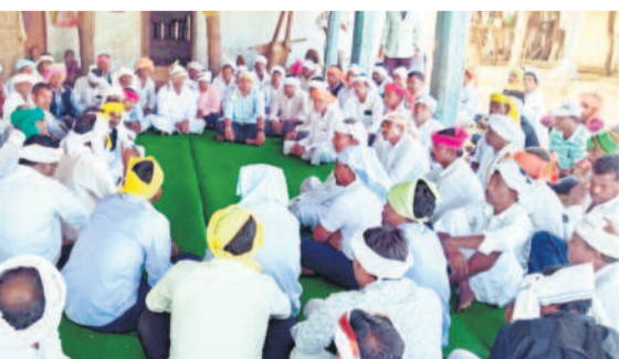
పాల్గొన్న సమావేశమైన బుగ్గారం వంశీయులు