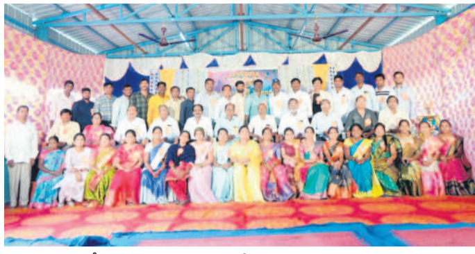
సోనీ జడ్పీసీఎస్ ఉన్నత పాఠశాలలో పూర్వ విద్యార్థులు, ఉపాధ్యాయులు