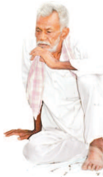
ఇలా పెంచుకుంటూ పోతూ రైతులకు పెట్టుబడి సాయాన్ని అందించేది. దీంతో రైతులు సీజన్ ముందుగానే తమకు అవసరమైన విత్తనాలు, ఎరువులు కోసు గేలు చేసి సంతోషంగా పంటలు పండించారు. ఈ ఏడాది యాసంగి సీజన్ ప్రారంభమై, నెల రోజులు దాటితే రైతుబంధు డబ్బులు రాకపోవడంతో రైతులు సంతోషం చెందుతున్నారు.

తాంసీ, జనవరి 7: గతంలో కేసీఆర్ ప్రభుత్వం రైతుబంధు పెట్టుబడి సాయం అందించేది. దీంతో రైతులు సీజన్ ముందుగానే తమకు అవసరమైన విత్తనాలు, ఎరువులు కోసు గేలు చేసి సంతోషంగా పంటలు పండించారు. ఈ ఏడాది యాసంగి సీజన్ ప్రారంభమై, నెల రోజులు దాటితే రైతుబంధు డబ్బులు రాకపోవడంతో రైతులు సంతోషం చెందుతున్నారు. గతంలో కేసీఆర్ ప్రభుత్వం రైతుబంధు పథకాన్ని ప్రారంభించింది. ఈ పథకంలో భాగంగా ఏటా రెండు పంటలకు గానూ ఎకరా రూ. 10 వేల సాయాన్ని కేసీ ఆర్ ప్రభుత్వం పంపిణీ చేసింది. గత ప్రభుత్వం అందించిన సాయంతో రైతులు వాసకాలం, యాసంగి పంటలను సాగు చేశారు. బీఆర్ఎస్ ప్రభుత్వం ప్రతి సీజన్కు ముందుగానే రైతులకు రైతుబంధు సాయాన్ని వారి బ్యాంకు ఖాతాల్లో జమచేసింది. మొదటి రోజు ఎకరం లోపు భూమి ఉన్న రైతులందరికీ రూ. 5వేల పెట్టుబడి సాయాన్ని వారి బ్యాంకు ఖాతాల్లో జమచేసింది. మరుసటి రోజు రెండోకారూ, మూడో రోజు మూడోకారూ అందించిన చెందుతున్నారు.