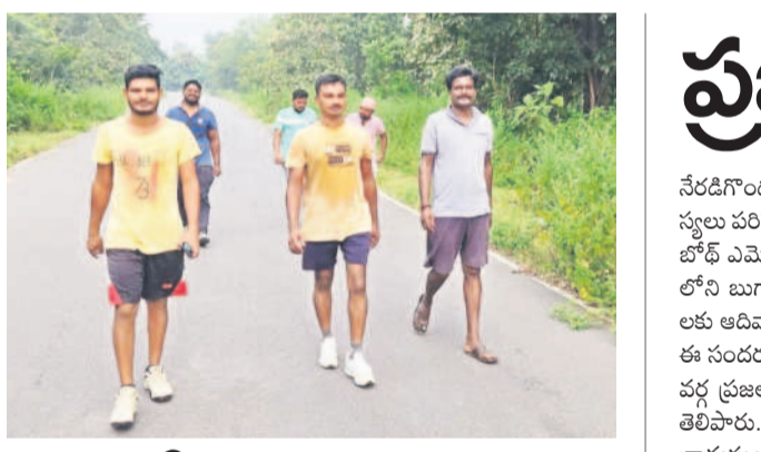
వాకింగ్ చేస్తున్న యువకులు, ప్రజలు