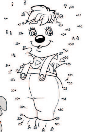
చుక్కల ఆధారంగా బొమ్మ గీసి, రంగులు వేయండి.