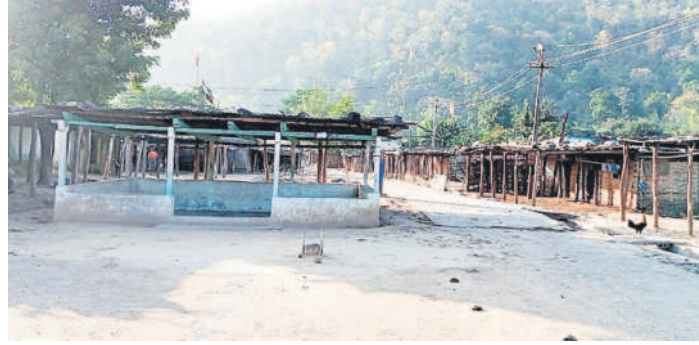
కొలాం నివాసముందున్న కల్చిగంగా గ్రామం