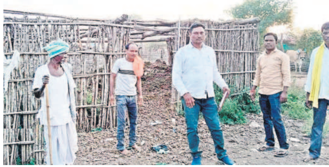
కొలాం గ్రామంలో సర్వే చేస్తున్న అధికారులు

కుటుంబం ఆసిఫాబాద్, (నమస్తే తెలంగాణ) / తెరమెరి జనవరి 6 : కేంద్ర ప్రభుత్వం కొలాం, తోటి, మన్నేవార్ల జనవస ప్రమాణాల్లో మాన్యులు తీసుకోవచ్చేందుకు జన్మన్ పథకాన్ని రూపొందించింది. ఈ పథకం ద్వారా ఆయా తెగలకు చెందిన గ్రామాల్లో పక్కా గృహాలు నిర్మించడం, ఇంటింటికీ తాగు నీరు, కెరెంట్ సౌకర్యం కల్పించడం, రోడ్లు వేయడం, ప్రతి గ్రామాన్ని నెట్ వర్క్తో అనుసంధానం చేయడం, సంపాద వైద్యాన్ని అందుబాటులోకి తీసుకురావడం, మిసి అంగన్ వాడీలు, ఏకాన్ కేంద్రాలు ఏర్పాటు చేయడం, ప్రాథమిక విద్యనందించడం, వృత్తి పరమైన పనులు అందుబాటులోకి రావడం