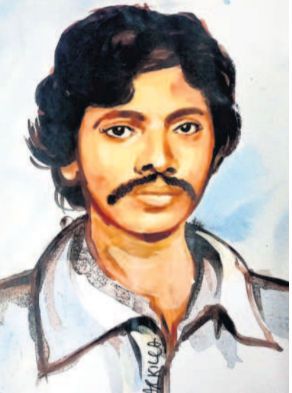
కూడా ఆయన మిగిలే ఉన్నారు. దుఃఖమా, ఆకలి అరకొర జీవితంలోని జరుగుబాటు లేకుండా కాల్చిన వేదన లేకుండా అలిశెట్టి ప్రభాకర్ కవిత్వమే లేదు.

జీవితంలోని ఆగ్రహ చింతన.. కవిత్వ ద్వారా.. ఇవి రెండింటినీ కలిపి సాధించిన సరళిని తనది. చదువుకున్న కొద్దీ, అనుభవం దగ్గరవుతున్న కొద్దీ పాఠకునిలో గాఢత పెరుగుతూ పోతుంటుంది. అందుకే ఇప్పటి తరానికి