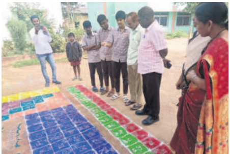
సైంటిఫిక్ రంగోలి మహోత్సవంలో పిరియాడిక్ టేబుల్ వేసిన విద్యార్థులు