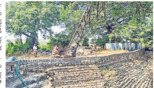
పూడికతీత పనుల్లో భాగంగా సఫాయిబావి వద్ద ఏర్పాటు చేసిన క్రేన్