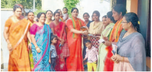
నేరేడుచర్లలోని 11వ వార్డులో ఇంటింటికీ అయోధ్య రామయ్య అక్షింతలు పంపిణీ చేస్తున్న భక్తులు

నేరేడుచర్ల, జనవరి 5 : అయోధ్య రామ మందిరంలో విగ్రహ ప్రాణ ప్రతిష్ఠ సందర్భంగా కలశాలలో పంపించిన అక్షింతలను శుక్రవారం మున్సిపాలిటీ పరిధిలోని 11వ వార్డులో భక్తులు ఇంటింటికీ పంపిణీ చేశారు. అక్షింతలతో పాటు రామ మందిరం చిత్రపటం, వివరాలతో కూడిన కరపత్రాన్ని అందజేశారు. నడిగూడెం : అయోధ్య రామ మందిర అక్షింతలను మండల కేంద్రంలో పాటు రత్నవరంలో రామ భక్తులు ఇంటింటికీ పంపిణీ చేశారు. ఈ