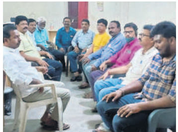
సమావేశంలో పాల్గొన్న అక్షర ఫౌండేషన్ సభ్యులు

సూర్యాపేట అర్బన్, జనవరి 5 : అక్షర ఫౌండేషన్, ఎన్కేఆర్ కన్వెన్షన్ ఆధ్వర్యంలో ఈ నెల 10న అక్షర సంక్రాంతి సంబురాలు నిర్వహిస్తున్నట్లు అక్షర ఫౌండేషన్ చైర్మన్ యాస రామ్కుమార్ తెలిపారు. శుక్రవారం జిల్లా కేంద్రంలో ఏర్పాటు చేసిన సమావేశంలో ఆయన మాట్లాడారు. సంబురల్లో భాగంగా ముగ్గుల పోటీలు, కోలాటం, గాలిపటాలు ఎగురవేయుట పోటీలతో పాటు చిన్నారలకు రేగి పండ్లు పోయడం, గంగి రెడ్డుల విన్యాసాలు, హరిదాసు కీర్తనలు, సాంస్కృతిక కార్యక్రమాలు నిర్వహించనున్నట్లు తెలిపారు. ప్రథమ బహుమతిగా రూ.3,116, ద్వితీయ రూ.2,516, తృతీయ రూ.2,016, కన్సోలేషన్ రూ.1,516 అందించనున్నట్లు చెప్పారు. పోటీలను జిల్లా కేంద్రంలోని మిసి ట్యూంక్ బండ్ బతు