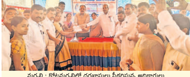
మర్చల్లి : కొటమర్చల్లిలో దరఖాస్తులు స్వీకరిస్తున్న అధికారులు