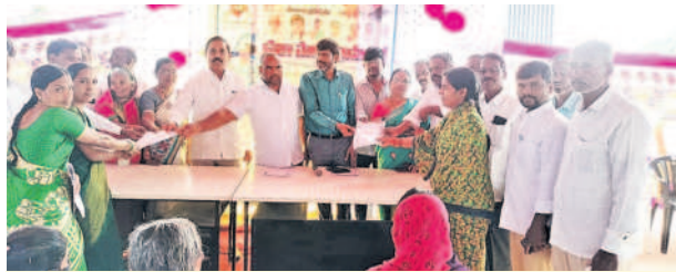
కొడంగల్ : ప్రజాపాలనలో దరఖాస్తులను స్వీకరిస్తున్న ఎంపీపీ, అధికారులు

కొడంగల్ : పేదల సంక్షేమానికి రాష్ట్ర ప్రభుత్వం 6 గ్యారెంటీలను అమలు చేస్తుందని ఎంపీపీ ముద్దుపల్లి దేశ్ ముఖ్ తెలిపారు. శుక్రవారం మున్సిపల్ పరిధిలోని ఆయా వార్డులతో పాటు మండలంలోని రుద్రారం, పాటుమీదిపల్లి గ్రామాల్లో ప్రజాపాలన కార్యక్రమం కొనసాగింది. ఈ సందర్భంగా ఆయన మాట్లాడుతూ.. ఇందిరమ్మ రాజ్యం సిద్ధించే దిశగా రాష్ట్ర ప్రభుత్వం 6 గ్యారెంటీల పథకాలను అమలు చేస్తుందని, పథకాలను అందుకునేందుకు అర్హత కలిగిన లబ్ధిదారులు దరఖాస్తు చేసుకోవాలని పేర్కొన్నారు. ప్రతి ఒక్కరినీ దరఖాస్తు చేసుకుంటే దరఖాస్తు ఫారాలను పరిశీలించడంలో ఆలస్యం తోపాటు ఇబ్బందులు తలెత్తే అవకాశం ఉంటుందన్నారు.