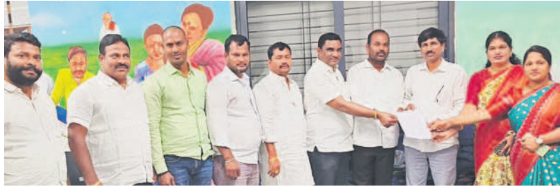
అవిశ్వాసం పెట్టాలని స్థానిక సంస్థల సూపరింటెండెంట్ కు తీర్మానం అందచేస్తున్న ఆదిబట్ల మున్సిపల్ కౌన్సిలర్లు

నగర శివారుల్లోని మున్సిపల్ కార్పొరేషన్లు, మున్సిపాలిటీల్లో అవిశ్వాసాల సీజన్ వచ్చింది. వాస్తవానికి చాలాచోట్ల ఏడాది, రెండేండ్లుగా మేయర్లు, చైర్మన్లు కార్పొరేటర్లు, కౌన్సిలర్లు గుర్తుగా ఉన్నారు. కానీ నిబంధనల ప్రకారం వారిపై అవిశ్వాసానికి అవకాశం లేకపోవడంతో ఇన్నాక్షన్ వారికి చేతులు కట్టే సీనియర్లుగా ఉండి, కానీ ఈ నెలా ఖర్చుతో దాదాపు అన్ని స్థానిక సంస్థల కాలం నాలుగు సంవత్సరాలు దాట నుండటంతో తిరుగుబాటు వుటాకు సిద్ధమవుతున్నారని భాగంగా