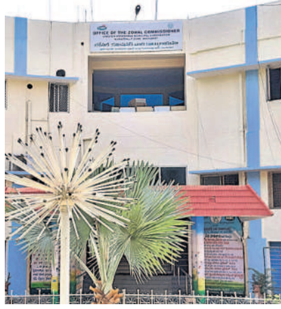
కూకట్‌పల్లి జోన్ కార్యాలయం

నెలవారీ లక్ష్యాలు.. జోన్ పరిధిలో నిర్దేశించిన ఆస్తిపన్ను వసూళ్ల లక్ష్యాన్ని సాధించే దిశగా ప్రత్యేక చర్యలు చేపడుతున్నారు. ఇప్పటికే మొండి బకాయిదారులను గుర్తించి జీహెచ్ఎంసీ, రెవెన్యూ చట్టం ప్రకారం రెడె నోటీసులు జారీ చేస్తున్నారు. ఫోన్లు, ఎస్ఎంఎస్ల ద్వారా సమాచారాన్ని అందిస్తూ సకాలంలో స్పందించాలని కోరుతున్నారు. లేకుంటే చట్ట ప్రకారం చర్యలు తప్పవని హెచ్చరికలు చేస్తున్నారు. మరోవైపు సర్కిళ్ల వారీగా ఉపకమిషనర్ల ఆధ్వర్యంలో రెవెన్యూ సిబ్బందికి నెలవారీ, రోజు వారీ లక్ష్యాలను నిర్దేశించారు. దీనిలో భాగంగా జోన్ పరిధిలోని ఐదు సర్కిళ్లలో జనవరిలో రూ.43.88 కోట్ల ఆస్తిపన్నులను వసూళ్లు చేయాలని లక్ష్యంగా పెట్టుకున్నారు. ఈ లక్ష్యాన్ని సాధించే దిశగా రెవెన్యూ సిబ్బంది బకాయిదారుల ఇంటికి వెళ్లి వెంటనే పన్నులు చెల్లించాలని కోరుతున్నారు. లేని పక్షంలో చట్టరీత్యా అస్తులను బిచ్చు చేయాల్సి వస్తుందని హెచ్చరికలు చేస్తున్నారు.