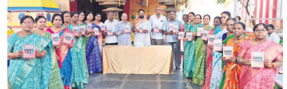
అధ్యయనోత్సవాల కరపత్రాలు ఆవిష్కరిస్తున్న భక్తులు

అధికారులు ఈ ఆపరేషన్లో భాగస్వాములుగా ఉన్నారు. జనవరి 31 వరకు తనిఖీలు చేపట్టి చిన్నారులకు విముక్తి కల్పించనున్నారు. జిల్లాలో ఇప్పటి వరకు 63 మంది యజమానులపై కేసులు నమోదయ్యాయి.