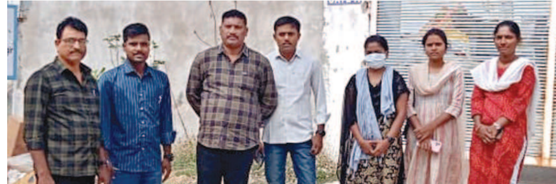
ఆపరేషన్ స్పైల్-10లో భాగంగా భువనగిరిలోని పాలిటామిక్ వాడలో తనిఖీకి వచ్చిన అధికారులు

ప్రతి సంవత్సరం జనవరిలో 'ఆపరేషన్ స్పైల్'ను నిర్వహిస్తుండగా యాదాద్రి భువనగిరి జిల్లా ఏర్పాటు తర్వాత చదో విడుదల చేపట్టారు. తప్పిపోయిన చిన్నారులను సాంతగూటికి చేర్చడం సహజ బాల కార్మికులను గుర్తించి ఆ వ్యవస్థ నుంచి విముక్తి కల్పించడమే దీని ప్రధాన లక్ష్యం. చదువు మధ్యలో మానేసిన వారు, యాతర వృత్తిలో కొనసాగుతున్న వారిని గుర్తించి వారిలో మార్పు తీసుకొస్తారు. భవిష్యత్తును మార్చడంపైనే దృష్టిని పెట్టి భాగస్వామ్యం చేస్తారు. ప్రధానంగా పోలీస్, బాలల పరిరక్షణ విభాగం, ప్రభుత్వేతర స్వచ్ఛంద సంస్థల సమన్వయంతో క్షేత్రస్థాయిలో పర్యటించి జిల్లాదే పడుతారు. జిల్లాను మూడు డివిజన్లుగా విభజించారు. భువనగిరి డివిజన్లో 8 మంది, చౌటుప్పల్ డివిజన్లో 8 మంది, యాదాద్రి డివిజన్లో ఏడుగురు