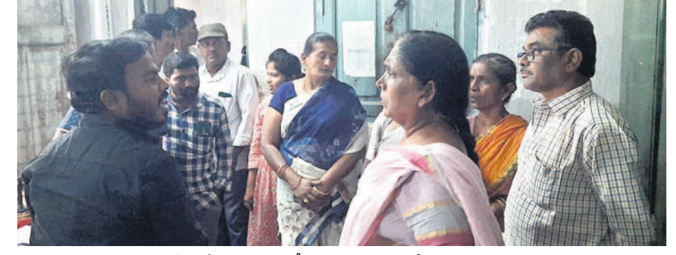
హిల్ కాలనీ హెడ్ పోస్ట్ ఆఫీసు వద్ద ఆందోళన చేస్తున్న ఖాతాదారులు