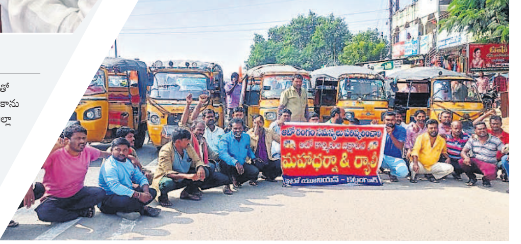
కట్టంగూర్లో ధర్మా చేస్తున్న ఆటో కార్మికులు