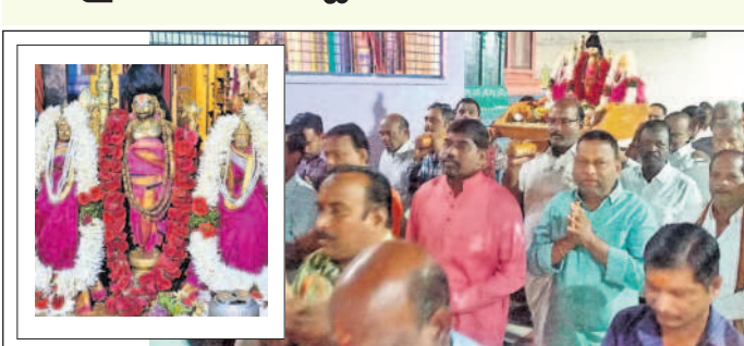
ఉత్సవవిధులను ఊరేగిస్తున్న దేవాలయ కమిటీ చైర్మన్, డైరెక్టర్లు, భక్తులు

రామాయంపేట, జనవరి 4 : రామాయంపేట పట్టణంలోని గోదానమేత వేంకటేశ్వర స్వామి, పద్మావతి ఉత్సవవిధులకు ఆలయ కమిటీ పల్లకీ సేవ నిర్వహించారు. గురువారం ధనుర్మాస ఉత్సవాల్లో భాగంగా ఉత్సవమూర్తులను అందంగా అలంకరించారు. అనంతరం వేద బ్రాహ్మణులు వేద మంత్రాలతో అభిషేకాలు, వైవేద్యాలు, మంగళహారతులను సమర్పించారు. దేవాలయ కమిటీ చైర్మన్, డైరెక్టర్లు, సిబ్బంది పాల్గొన్నారు.