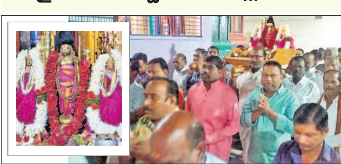
ఉత్సవవిధులను ఊరేగిస్తున్న దేవాలయ కమిటీ చైర్మన్, డైరెక్టర్లు, భక్తులు

రామాయంపేట, జనవరి 4 : రామాయంపేట పట్టణంలోని గోదానమేత వేంకటేశ్వర స్వామి, పద్మావతి ఉత్సవవిధులకు ఆలయ కమిటీ పల్లకీ సేవ నిర్వహించారు. గురువారం ధనుర్మాస ఉత్సవాల్లో భాగంగా ఉత్సవమూర్తులను అందంగా అలంకరించారు. అనంతరం వేద బ్రాహ్మణులు వేద మంత్రాలతో అభిషేకాలు, వైవేద్యాలు, మంగళహారతులను సమర్పించారు. దేవాలయ కమిటీ చైర్మన్, డైరెక్టర్లు, సిబ్బంది పాల్గొన్నారు.