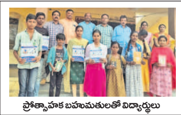
ప్రోత్సాహక బహుమతులతో విద్యార్థులు

రామాయంపేట, జనవరి 4: రామాయంపేట మండలం ఝాన్సీలింగాపూర్ లోని ప్రభుత్వ ఉన్నత పాఠశాల విద్యార్థులు డిసెంబర్ నెలలో వందశాతం