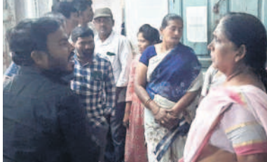
హిల్ కాలనీ హెడ్ పోస్టాఫీస్ వద్ద ఆందోళన చేస్తున్న బాధితురాలు