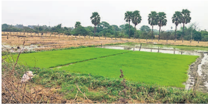
నాటుకు సిద్ధంగా ఎదిగిన నారుమడి

మద్దూరు (దూశిమిట్ల), జనవరి 4: వానకాలంలో పంటలు సమృద్ధిగా పండి ఆశించిన స్థాయిలో దిగుబడులు రావడంతో రైతులు సంతోషంగా ఉన్నారు. అదే ఉత్సాహంతో యాసంగి పనుల్లో నిమగ్నమయ్యారు. నిన్నమొన్నటి వరకు వరికోతలు, పత్తితీత తదితర వ్యవసాయ పనులతో బిజీబిజీగా గడిపిన రైతులు తిరిగి యాసంగి పనులు మొదలుపెట్టారు. ఉమ్మడి మద్దూరు మండలంలోని అన్ని గ్రామాల్లో ఇప్పటికే యాసంగి సాగు కోసం రైతులు నారుమడులను సిద్ధం చేసుకుని పాలం దున్నకాల్లో నిమగ్నమయ్యారు. దీంతో గ్రామాల్లో ఎక్కడచూసినా యాసంగి పనులు చురుగ్గా సాగుతున్నాయి. ట్రాక్టర్లకు ఒక్కసారిగా గిరాకీ పెరిగింది. వరి సాగులో రైతులు ప్రత్యామ్నాయ పద్ధతులపై దృష్టి సారినారు. చెరువులు, వాగులతోపాటు బోరుబావుల నిండా నీరు ఉండడంతో రైతులు వడివడిగా యాసంగి సాగు పనుల