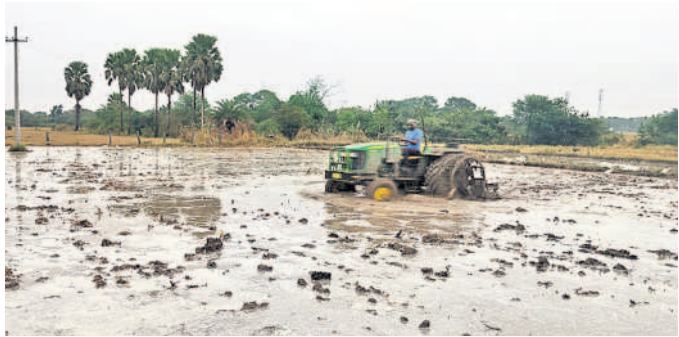
మద్దూరులో ట్రాక్టర్ తో పాలం దున్నుతున్న రైతు