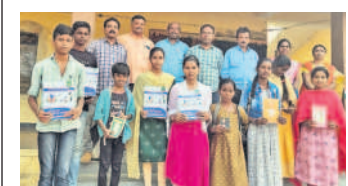
ప్రోత్సాహక బహుమతులతో విద్యార్థులు

రామాయంపేట, జనవరి 4: రామాయంపేట మండలం ఝాన్సీలింగాపూర్ లోని ప్రభుత్వ ఉన్నత పాఠశాల విద్యార్థులు డిసెంబర్ నెలలో వందశాతం