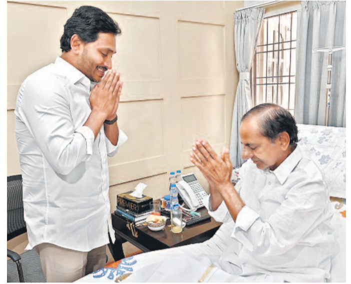
గురువారం బీఆర్ఎస్ అధినేత కేసీఆర్ను పరామర్శిస్తున్న ఏపీ సీఎం జగన్