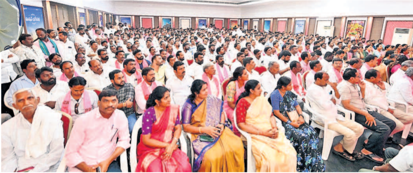
కార్యకర్తలు, నాయకుల రాకతో తెలంగాణభవన్ మరోసారి సందడిగా మారింది. గురువారం జరిగిన కరీంనగర్ లోక్సభ నియోజకవర్గ సమావేశంలో పాల్గొన్న నేతలు

79 పరుగుల స్వల్ప లక్ష్యవేదనలో మూడు వికెట్లు చేజారుతున్న భారత్.. కేవలం రోహిత్ శర్మ విజయాన్ని సగర్వంగా ముద్దాడింది. ఫలితంగా భారత్, దక్షిణాఫ్రికా మధ్య మ్యాచ్ అతి తక్కువ (642) బంతుల్లో ముగిసిన టెస్టుగా అరుదైన రికార్డు సాధించింది. రెండు మ్యాచ్ల ఫ్రీడమ్ నిరీస కాస్త 1-1తో సమంగా ముగిసింది.