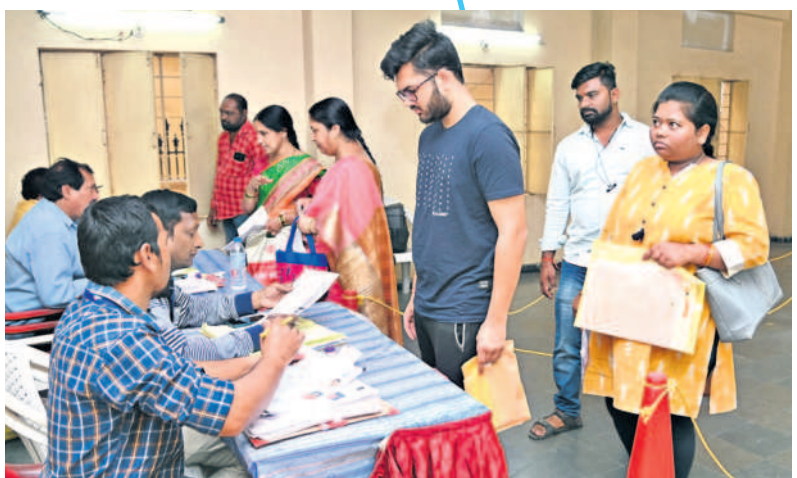
నల్లకుంటలో దరఖాస్తులు స్వీకరిస్తున్న అధికారులు