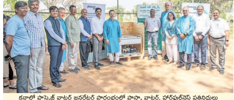
కన్వాలీ ప్లాస్టెజ్జ్ వాటర్ జనరేటర్ ప్రారంభంలో పాల్గొన్న వ్యక్తులు

జిల్లాలో నీటిపారుదల పెరిగిన నేపథ్యంలో ఏటలా సాగు విస్తీర్ణంతోపాటు ధాన్యం దిగుబడులు పెరుగుతూ వస్తున్నాయి. పంటలు అమ్ముకునేందుకు రైతులు ఎటువంటి ఇబ్బందులు పడకుండా ఉండేందుకు గత ప్రభుత్వం