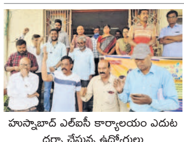
హుస్సాబాద్ ఎల్ఐసీ కార్యాలయం ఎదుట ధర్మా చేస్తున్న ఉద్యోగులు

బెజ్జంకి, జనవరి 3 : మండలంలోని రేగులపల్లి స్టేజీ వద్ద రాజీవ్ రహదారిపై గుర్తుతెలియని వాహనం ఢీకొని ఓ వ్యక్తి మృతి చెందాడు. ఎస్సె నరేందర్ రెడ్డి వివరాల ప్రకారం.. గుర్తుతెలియని వాహనం ఢీకొన్నంతో ఆ వ్యక్తి అక్కడికక్కడే మృతి చెందాడని తెలిపారు. మృతుడు 5.5 అడుగుల ఎత్తు కలిగి గోధుమ రంగు ప్యాంటు, బ్లూ కలర్ షర్ట్ ధరించి ఉన్నాడని చెప్పారు. సిద్దిపేట ప్రభుత్వ దవాఖాన మార్చురీలో మృతదేహం ఉందని, ఎవరైనా గుర్తిస్తే వెంటనే పోలీసులకు సమాచారం అందించాలని కోరారు. పంధాయతీ కార్యదర్శి జీవన్ రెడ్డి ఫిర్యాదు మేరకు కేసు నమోదు చేసి దర్యాప్తు చేస్తున్నట్లు ఎస్సె తెలిపారు.