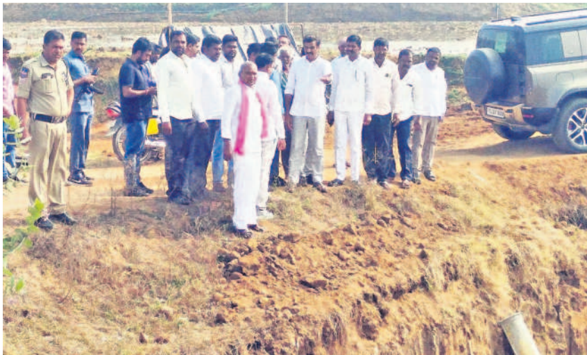
అచ్చమాయిపల్లి శివారులో మల్లన్న సాగర్ సబ్ కాల్వల నిర్మాణ పనులను పరిశీలిస్తున్న ఎమ్మెల్యే ప్రభాకర్ రెడ్డి

రైతుల సంక్షేమమే లక్ష్యంగా కేసీఆర్ సర్కారు ఎంతగానో కృషిచేసి మల్లన్న సాగర్ ప్రాజెక్టును నిర్మించిందిని దుబ్బాక ఎమ్మెల్యే కొత్త ప్రభాకర్ రెడ్డి తెలిపారు. మల్లన్న సాగర్ కాల్వల నిర్మాణంలో అధికారులు, కాంట్రాక్టర్లు నిర్లక్ష్యంగా వ్యవహరించడం సరికాదన్నారు. దుబ్బాక మండలం పోతారం, గంభీరపూర్, అప్పమాయి పల్లి గ్రామాల మీదుగా నిర్మిస్తున్న మల్లన్న సాగర్ ఎల్ 4 కాల్వల పనులను బుధవారం ఇరిగేషన్ అధికారులతో కలిసి ఆయన పరిశీలించారు. మల్లన్న సాగర్ కాల్వల నిర్మాణంలో జూప్యంపై ఎమ్మెల్యే స్పందించారు. మల్లన్న సాగర్ కాల్వల పనులు పూర్తిచేసి ఆకుపచ్చ దుబ్బాకగా తీర్చిదిద్దు తానని తెలిపారు. కేసీఆర్ బడి భవనంలో డిగ్రీ కళాశాల ఏర్పాటుకు చర్యలు చేపడుతామని, ఈ బడిని సర్వీనియోగం చేసుకోవాలని కోరారు. - దుబ్బాక, జనవరి 3