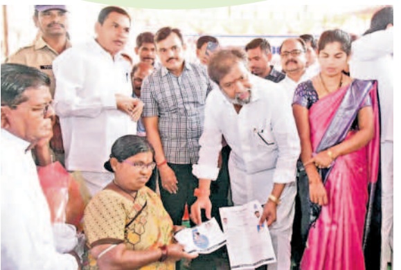
రాయికోడ్ లో మహిళ నుంచి ప్రజాపాలన దరఖాస్తు స్వీకరిస్తున్న మంత్రి దామోదర రాజనర్సింహ