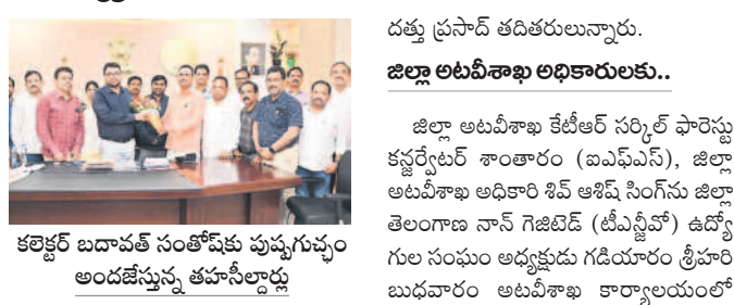
కలెక్టర్ బదావత్ సంతోషకు పుష్పగుచ్ఛం అందజేస్తున్న తహసీల్దార్లు

హజరైన ఎమ్మెల్యే దండె విఠల్ కలెక్టర్ బదావత్ సంతోషకు పుష్పగుచ్ఛం అందజేస్తున్న తహసీల్దార్లు. హజరైన ఎమ్మెల్యే దండె విఠల్ కలెక్టర్ బదావత్ సంతోషకు పుష్పగుచ్ఛం అందజేస్తున్న తహసీల్దార్లు. హజరైన ఎమ్మెల్యే దండె విఠల్ కలెక్టర్ బదావత్ సంతోషకు పుష్పగుచ్ఛం అందజేస్తున్న తహసీల్దార్లు.