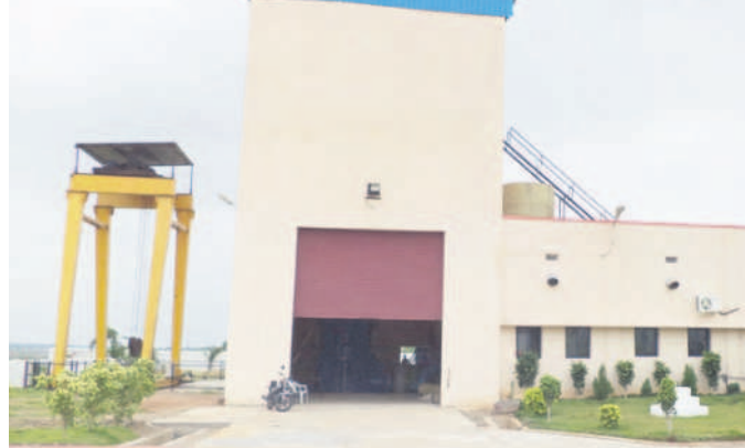
గూడెం ఎత్తిపోతల పథకం

దండెపల్లి, జనవరి 3 : దండెపల్లి మండలంలోని గూడెం శ్రీసత్యనారాయణ స్వామి ఎత్తిపోతల పథకం నుంచి ఈనెల 6న నీటిని విడుదల చేయనున్నారు. జిల్లా కేంద్రంలో మంచి రాల్గుతుంది కలెక్టర్ బదావత్ సంతోషకు పుష్పగుచ్ఛం అందజేస్తున్న తహసీల్దార్లు. హజరైన ఎమ్మెల్యే దండె విఠల్ కలెక్టర్ బదావత్ సంతోషకు పుష్పగుచ్ఛం అందజేస్తున్న తహసీల్దార్లు.