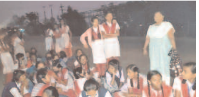
పోవంపల్లి వద్ద రోడ్డుపై చీకట్లోనే విద్యార్థులు, వారితో పాటు ఉపాధ్యాయురాలు

మానకొండలో రూరల్, జనవరి 3: మహా లక్ష్మీ పడకం కింద మహిళలకు బస్సు ఫ్రీ వారికి ఎంతో సంతోషాన్నిస్తున్నాడగా, విద్యార్థులకు మాత్రం చుక్కలు చూపిస్తున్నది. ఉదయం ఎలాగోలా కష్టపడి కాటేజీలు, పాఠశాలలకు వెళ్తున్న పిల్లలు, సాయంత్రం బస్సులు ఖాళీగా రాక తిరిగి ఇళ్లకు చేరలేకపోతున్నారు. బుధవారం మానకొండలో మండల పోవంపల్లి అడల్ట్ పాఠశాల విద్యార్థులు తీవ్ర ఇబ్బందులు పడ్డారు. సమీప గ్రామాల నుంచి ఇక్కడికి వచ్చి అభ్యసించే విద్యార్థులు దాదాపు 87 మంది పాఠశాల విడిచిన తర్వాత ఇంటికి వెళ్లేందుకు 4 గంటలకు