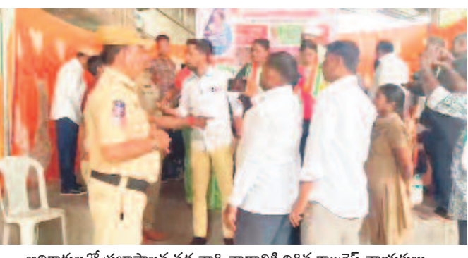
అధికారులతో ప్రజాపాలన వద్ద వాగ్వాదానికి దిగిన కాంగ్రెస్ నాయకులు

వేదికపై కూర్చోనివ్వాలని అధికారులతో వాగ్వాదం కరీంనగర్ కార్పొరేషన్, జనవరి 3: ఆరు గ్యారంటీల అమలు కోసం అంతటా దరఖాస్తులు స్వీకరిస్తున్నారు. ప్రభుత్వ వరంగా సాగుతున్న ఈ కార్యక్రమాల్లో కాంగ్రెస్ నాయకులు అత్యుత్సాహం చూపుతున్నారని పలువురు విమర్శిస్తున్నారు. కేంద్రం వద్ద ఏర్పాటు చేసిన వేదికలపై తమను కూర్చోనివ్వాలంటూ అధికారులపై ఒత్తిడి తెస్తున్నారు. ఇదే విషయమై బుధవారం కరీంనగర్లోని 5వ డివిజన్లో అధికారులు, స్థానిక ప్రజాప్రతినిధులు, కాంగ్రెస్ నాయకుల మధ్య వాగ్వాదం జరిగింది. అధికారిక కార్యక్రమంలో ఇతరులకు అవకాశం ఉండని చెప్పినా వినిపించుకోలేదు. దీంతో పోలీసులు జోక్యం చేసుకొని వారిని అడ్డుకున్నారు. దరఖాస్తు చేసుకోవడానికి వచ్చే ప్రజలకు సూచనలు చేయవచ్చుగానీ, కేంద్రంలోని స్టేజీ వద్ద కూర్చోవడానికి వీలు లేదని చెప్పడంతో సైలెంట్ అయిపోయారు. చక్కన ఉండి వచ్చే ప్రజల నుంచి దరఖాస్తులు తీసుకొని అధికారులకు అందించారు.