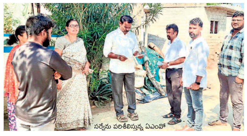
సర్వేను పరిశీలిస్తున్న ఎంపీతో...