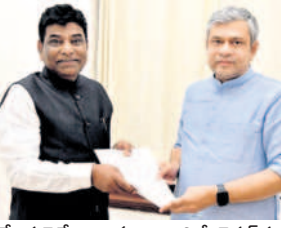
కేంద్ర రైల్వేశాఖ మంత్రి అశ్వినీచంద్ పంట్... కేంద్ర రైల్వేశాఖ మంత్రి అశ్వినీచంద్ పంట్...