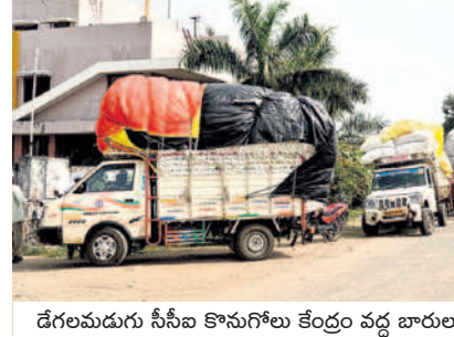
దేశగమగు సీసీఐ కొనుగోలు కేంద్రం వద్ద బారులు తీసిన పత్తి వాహనాలు

సులువు కావడంతో రైతులు సబ్ మార్కెట్లో ప్రాధాన్యం ఇస్తున్నారు. జిల్లాలోని నాలుగు సీసీఐ కొనుగోలు కేంద్రాల్లో విక్రయాలు జరుగుతున్నాయి.