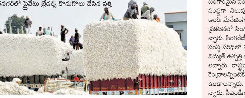
సుజాతనగరంలో పైవేటూ త్రేడర్స్ కొనుగోలు చేసిన పత్తి

భద్రాద్రి కొత్తగూడెం, జనవరి 3 (నమస్సే తెలంగాణ ప్రతినిధి) : జిల్లాలోని సబ్ మార్కెట్లో పత్తి విక్రయాలు జోరందుతున్నాయి. మద్దతు ధర ఉన్నా సీసీఐ కేంద్రాల వద్ద పత్తి విక్రయాలు జరుగుతున్నాయి.