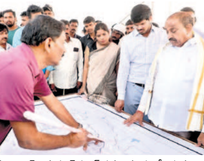
సీతారామ ప్రాజెక్టు 4వ పంచహాజీ పనులను పరిశీలిస్తున్న మంత్రి తుమ్మల కల్వెర్ర వీపీ గౌతమ్, ప్రయాంక ఆల

భద్రాద్రి కొత్తగూడెం, జనవరి 3 (నమస్సే తెలంగాణ ప్రతినిధి) : సీతారామ ప్రాజెక్టు నిర్మాణ పనుల్లో వేగం పెంచాలని రాష్ట్ర వ్యవసాయ, సహకార, మార్కెటింగ్ శాఖ మంత్రి తుమ్మల కల్వెర్ర వీపీ గౌతమ్, ప్రయాంక ఆలతో కలిసి భద్రాద్రి జిల్లా దమ్మపేట మండలం గండుగులపల్లి ప్రాజెక్టు 4వ పంచహాజీ పనులను పరిశీలించి ఇరిగేషన్ అధికారులకు పలు అంశాలపై సూచనలిచ్చారు.