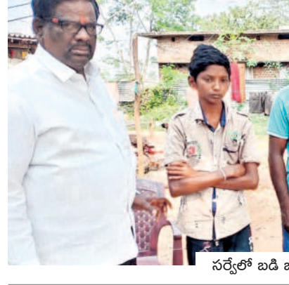
సర్వేలో బడి బయట పిల్లల వివరాలను సేకరించేందుకు సిఆర్ టీఎల్ సర్వే

బాలబాలికలు బడిలో ఉండేలా.. జిల్లాలో ఉన్న బడి బయట పిల్లల వివరాలను సేకరించేందుకు 111 మంది సిఆర్ టీఎల్ సర్వే చేయనున్నారు.