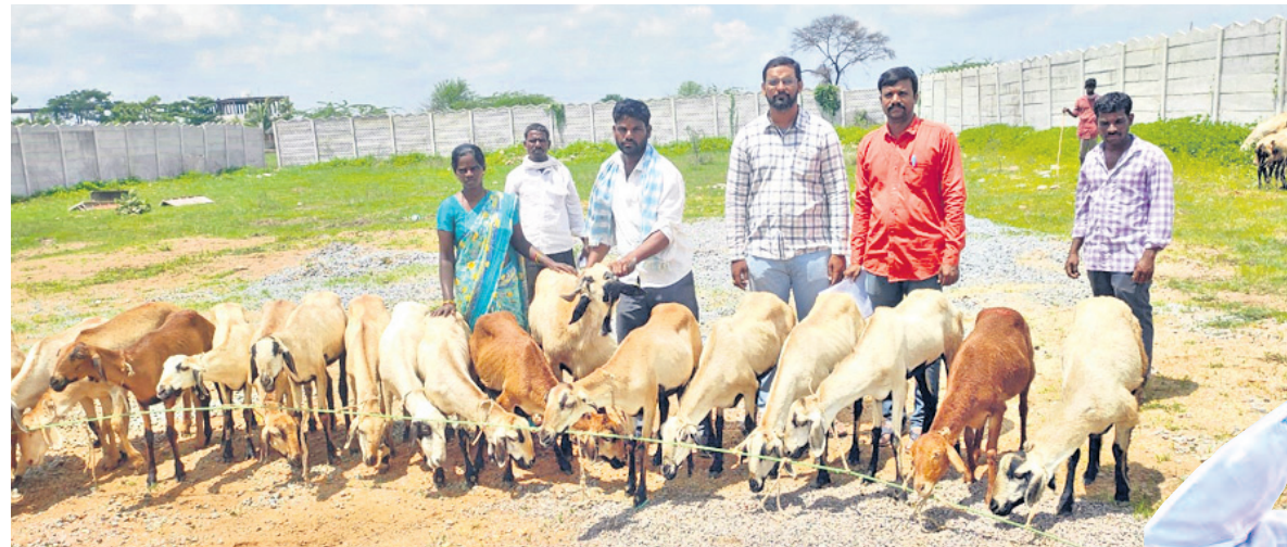
టీక్కాల్ మండలం అనన్తపర్వ దేవస్థలలో గొర్రెల యూనిట్తో దళితులు (ఫైల్)

కేసీఆర్ సర్కార్ అమలు చేసిన దళితబంధు పథకం రెండో విడత కోసం దళిత కుటుంబాలు ఎదురుచూస్తున్నాయి. అయితే గత సర్కారు హయాంలో ఒక్కో దళిత కుటుంబానికి రూ.10 లక్షల ఆర్థిక సాయం చేయగా, కాంగ్రెస్ సర్కార్ అధికారంలోకి వచ్చిన తర్వాత దళితబంధు పథకాన్ని అంచెదగ్గరే ఆభయహస్తం వేరుతో దళితులకు జీవనోపాధి కల్పిస్తామని భరోసా ఇచ్చింది. అయితే, రెండో విడతలో మెడక్ జిల్లాలో సుమారుగా 9వేల మంది దళితులకు దళితబంధు అమలు చేయాలని కేసీఆర్ సర్కారు నిర్ణయించింది. కానీ ఎన్నికల నోటిఫికేషన్ వెలువడడంతో దానికి బ్రేక్ పడింది. అప్పటికే జిల్లావ్యాప్తంగా 1200 మంది లబ్ధిదారులను గుర్తించినప్పటికీ మంజూరు చేసే అవకాశం లేకుండాపోయింది. దీంతో, రెండో విడత ప్రక్రియ మళ్ళీ ఎప్పుడు మొదలుపెట్టబోవోనని ఎదురుచూస్తున్నారు.