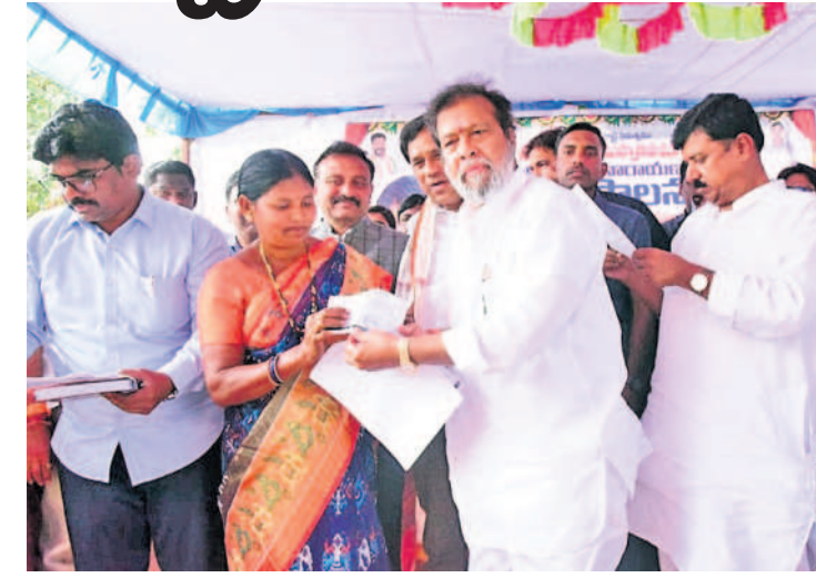
మన్యూర్ పూర్ ప్రజాపాలనలో దరఖాస్తు స్వీకరణం రసీదు అందజేస్తున్న మంత్రి దామోదర రాజనర్సింహ

నారాయణపేట, జనవరి 2: రాజకీయాలకంటే తగా అర్దులందరికీ ఆరు గ్యారెంటీలను అమలు చేస్తామని వైద్యారోగ్యశాఖ మంత్రి దామోదర రాజనర్సింహ అన్నారు. మంగళవారం నారాయణపేట మండలంలోని హన్మంతపూర్ వద్ద, నారాయణపేట మున్సిపాలిటీ పరిధిలోని 8వ వార్డు మన్యూర్ పూర్లో నిర్వహించిన ప్రజాపాలన కార్యక్రమంలో మంత్రి పాల్గొని మాట్లాడారు. ఆరు గ్యారెంటీల్లో ఇప్పటికే మహిళలకు ఉచిత బస్సు ప్రయాణం, రూ.10 లక్షల వరకు ఆరోగ్యశ్రీ పథకాలను అమలుచేస్తున్నట్లు చెప్పారు. మిగతా గ్యారెంటీలను సైతం అమలుచేస్తామన్నారు.. 6వ తేదీ వరకు చేపట్టిన ప్రజాపాలన గ్రామసభల్లో ఆయా పథకాల కోసం దరఖాస్తు చేసుకోవాలన్నారు. నారాయణపేట నియోజకవర్గ అభివృద్ధి ప్రతిపత్తి సారినామినాని అన్నారు. అనంతరం మంత్రి మహిళల నుంచి దరఖాస్తులు స్వీకరించి రసీదులు అందజేశారు. పలువురికి కల్యాణలక్ష్మి,