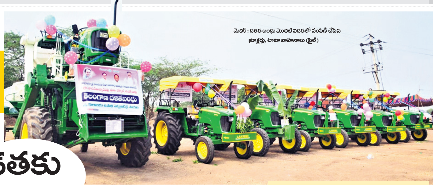
మెడక్ : దళిత బంధు మొదటి విడతలో పంపిణీ చేసిన ట్రాక్టర్లు, టాటా వాహనాలు (ఫైల్)