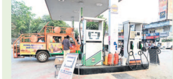
పెద్దగూడ బంకుల వద్ద నో స్టాప్ బోర్డు పెట్టిన యాజమాన్యం

మంచీర్యాల అర్బన్, జనవరి 2 : పెద్దగూడ, డిజిల్ లాగి ట్యాంకర్ల డ్రైవర్లు సమ్మెలోకి వెళ్లగా.. మంగళవారం వాహనదారులు బంకుల వద్ద బారులు తీరారు. ఉమ్మడి ఆదిలాబాద్ జిల్లాలో ఏ బంకు వద్ద చూసినా వాహనాల రద్దీ కనిపించింది. ట్రాక్టర్లు, లారీలు, స్కూలు బస్సులు, ద్వీచక్ర వాహనాలు పెద్ద సంఖ్యలో వేరుకోవడంతో ఆయాచోట్ల ట్రాఫిక్ జామ్ అయ్యింది. కొందరు ద్వీచక్ర వాహనదారులు బాటిల్లో పెద్దగూడ పోయి చింతింపబడుతుండగా, మిగతా వారు గొడవకు దిగడంతో బాటిల్లో పెద్దగూడ పోయడం నిలిచిపోయింది. కొన్ని బంకుల్లో నో స్టాప్ బోర్డులు పెట్టారు. ఇక మిగతా బంకుల్లో ఇందనం అయిపోతే పరిస్థితి ఏమిటని అందోళ్లన చెందుతుండగా, సాయంత్రం సమయం వచ్చేటట్లు ట్యాంకర్ల డ్రైవర్లు ప్రకటించడంతో అంతా ఊపిరిపీల్చుకున్నారు. సీల్స్ మేనేజర్ల స్వయంగా వచ్చి రాత్రి వరకు పూర్వయల్ వసపందని చెప్పినా వాహనదారులు వివరాలేవీ గమనార్హం.