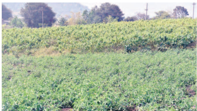
మిశ్రమ పద్ధతుల్లో పంటలు సాగుచేస్తున్న రైతులు

కుస్తుం భీం ఆసిఫాబాద్, జనవరి 2 (నమస్తే తెలంగాణ) : జిల్లా రైతులు మిశ్రమ సాగుపై మక్కువ చూపుతున్నారు. తమకున్న మామూలు పంటల వేస్తూ లాభాలు బాట పడుతున్నారు. మారు తన్ను పరిస్థితులకు అనుగుణంగా.. మార్కెట్ డిమాండ్ను బట్టి ప్రధానంగా సూసె గింజల సాగుపై ఆసక్తి చూపుతున్నారు. సంప్రదాయ పంటలైన పత్తి, వరి, కందికి బదులుగా వేరుశనగ, పొద్దు తిరుగుడు, నువ్వులు, కుసుమవంటి వాటిపై మొగ్గు చూపుతున్నారు. యేటా ఒకేరకమైనవి వేసి కొద్దిపాటి భూమిలో రకరకలా పంటలు వేస్తూ లాభాలు బాట పడుతున్నారు. మారు తన్ను పరిస్థితులకు అనుగుణంగా.. మార్కెట్ డిమాండ్ను బట్టి ప్రధానంగా సూసె గింజల సాగుపై ఆసక్తి చూపుతున్నారు. సంప్రదాయ పంటలైన పత్తి, వరి, కందికి