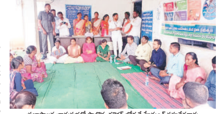
ప్రజాపాలన గ్రామసభలో పాల్గొన్న కలెక్టర్ బోర్డే హేమంత్ సహదేవరావు

రెవెన్యూ, జనవరి 2 : అభివృద్ధి కోసం గ్యారెంటీ పథకాల కోసం దరఖాస్తులివ్వాలి, అప్పుడే పథకాలు అందుతాయని కుస్తుం భీం ఆసిఫాబాద్ కలెక్టర్ బోర్డే హేమంత్ సహదేవరావు పేర్కొన్నారు. మంగళవారం రోజువారీ గ్రామ పంచాయతీలో నిర్వహించిన ప్రజాపాలన దరఖాస్తుల స్వీకరణకు హాజరై మాట్లాడారు. ఈ సేవ తెలిస్తే గ్రామ పంచాయతీ కార్యాలయం వద్ద ఏర్పాటు చేసిన కౌంటర్లో దరఖాస్తులు అందించాలి. దరఖాస్తు ఫార్మానికి పోల్ అంటివి అధారీ, రేషన్ కార్డు జత చేస్తే సరిపోతుంది. ప్రజల నుంచి వచ్చే ప్రతి దరఖాస్తును అందరికీ స్వీకరించి రసీదు అందించాలని అధికారులకు సూచించారు. ఈ కార్యక్రమంలో సైఫల్ ఆసిఫాబాద్ కలెక్టర్, ఎంపీడి పరిశీలక శ్రీనివాస్, రేషన్ కార్డు జత చేస్తే సరిపోతుంది. ప్రజల నుంచి వచ్చే ప్రతి దరఖాస్తును అందరికీ స్వీకరించి రసీదు అందించాలని అధికారులకు సూచించారు. ఈ కార్యక్రమంలో పాల్గొన్న కలెక్టర్ బోర్డే హేమంత్ సహదేవరావు