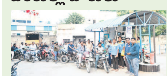
పెద్దగూడ బంకుల వద్ద పెద్ద క్యూలో వాహనాలు

మంచీర్యాల అర్బన్, జనవరి 2 : పెద్దగూడ, డిజిల్ లాగి ట్యాంకర్ల డ్రైవర్లు సమ్మెలోకి వెళ్లగా.. మంగళవారం వాహనదారులు బంకుల వద్ద బారులు తీరారు. ఉమ్మడి ఆదిలాబాద్ జిల్లాలో ఏ బంకు వద్ద చూసినా వాహనాల రద్దీ కనిపించింది. ట్రాక్టర్లు, లారీలు, స్కూలు బస్సులు, ద్వీచక్ర వాహనాలు పెద్ద సంఖ్యలో వేరుకోవడంతో ఆయాచోట్ల ట్రాఫిక్ జామ్ అయ్యింది. కొందరు ద్వీచక్ర వాహనదారులు బాటిల్లో పెద్దగూడ పోయి చింతింపబడుతుండగా, మిగతా వారు గొడవకు దిగడంతో బాటిల్లో పెద్దగూడ పోయడం నిలిచిపోయింది. కొన్ని బంకుల్లో నో స్టాప్ బోర్డులు పెట్టారు. ఇక మిగతా బంకుల్లో ఇందనం అయిపోతే పరిస్థితి ఏమిటని అందోళ్లన చెందుతుండగా, సాయంత్రం సమయం వచ్చేటట్లు ట్యాంకర్ల డ్రైవర్లు ప్రకటించడంతో అంతా ఊపిరిపీల్చుకున్నారు. సీల్స్ మేనేజర్ల స్వయంగా వచ్చి రాత్రి వరకు పూర్వయల్ వసపందని చెప్పినా వాహనదారులు వివరాలేవీ గమనార్హం.