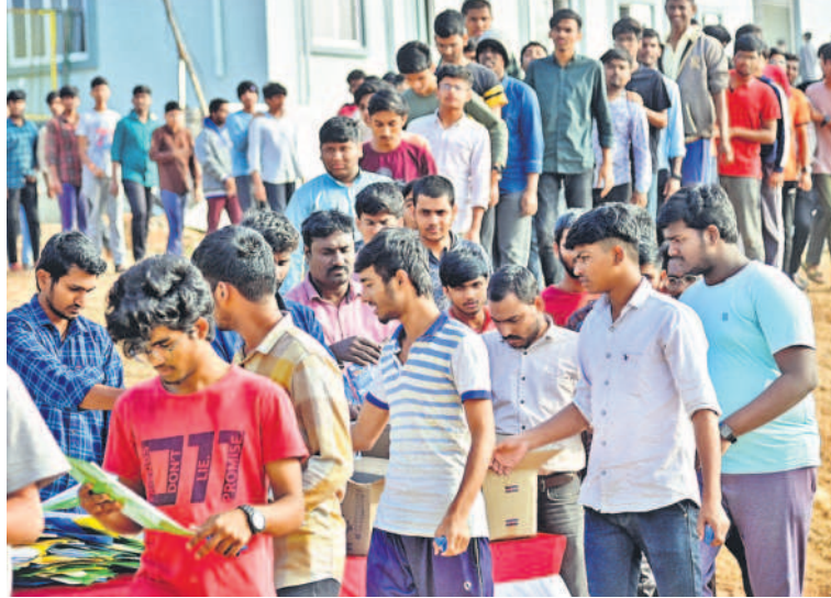
చరక భవన్లో సెమినార్కు హాజరవుతున్న విద్యార్థులు