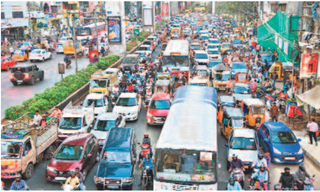
ట్రక్కులు, ట్యాంకర్ డ్రైవర్ల సమ్మెతో రవాణా స్తంభిల్లింది. పెట్రోల్ కోసం బంకులకు జనం పోటెత్తారు. కిలోమీటర్ల కొద్ది ట్రాఫిక్ జామలతో నగర రోడ్లపై వాహనదారులకు నరకం కనిపించింది. హైదరాబాద్లోని జేగంపేటలో రోజంతా కనిపించిన దృశ్యమిది.